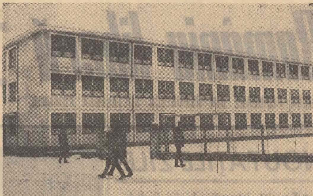
Odată cu actualul an școlar, în cartierul Lazaret din Sibiu s-au deschis porțile unei noi școli. Aceasta dispune de 16 săli de clasă, o sală de gimnastică, laboratoare, săli pentru profesori etc.