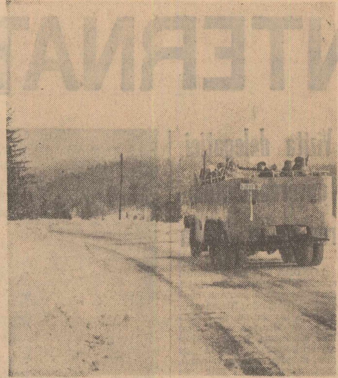
In drum spre Polana Brașov