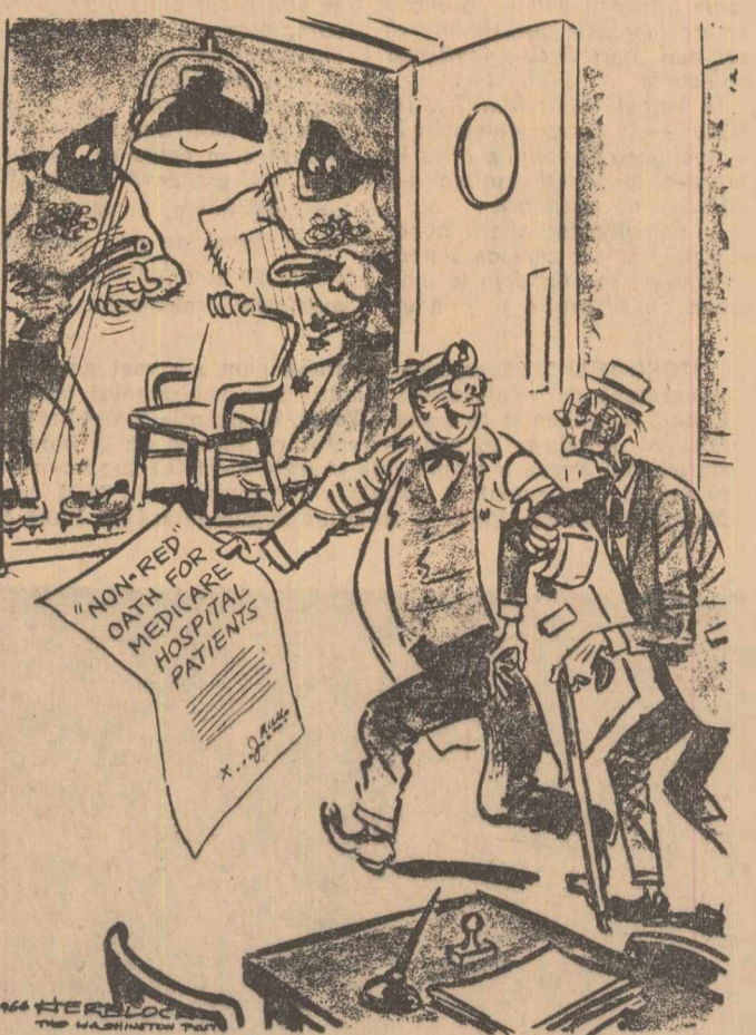
Caricatura de mai sus, apărută în ziarul The Washington Post, se referă la o lege votată de Congres, privind asistența medicală gratuită pentru bătrînii lipsiți de mijloace din S.U.A. Același articol al legii prevede ca persoanele care apelează la această asistență, să semneze o declarație că nu fac și n-au făcut parte, în ultimul an din vreoa organizare a Partidului comunist sau avînd legături cu partidul. În desen, doctorul îi spune bătrînului venit la consultație: „Acum, cînd veți intra chiar în cabinet...” În cabinet „asistenții” — două „gorile” mascate de la F.B.I., fiind pregătite batoanele de cauciuc, așteaptă pe bătrîn, pentru a „verifica” declarația lui, în care scrie: „Nu sînt roșu — legămînt pentru pacienții asistenței medicale gratuite”

Sedința Comisiei a decurs într-o atmosferă de prietenie frățască și înțelegere reciprocă.