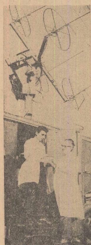
Observatorul aerologic al Institutului meteorologic din Capitală. Cu ajutorul radioteodolului se urmăresc radiondele care măsoară unele elemente meteorologice din atmosfera înaltă

va se afișaseră la intrarea unor blocuri adresele unităților de servicii de primă necesitate aflate în apropiere. Inițiativa s-a dovedit bună, dar n-a fost extinsă și continuată. Într-o timp, afișele, învechite, au fost scoase. Ghidurile unităților de servicii, altele cum apar, sînt și ele acum perimate. Așa sînd lucrurile era necesar să se caute alte soluții operative, eficiente. Bunăoară, în afară de reclame în ziare, la radio și la televizi-