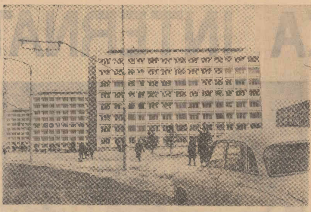
În imediata apropiere a noii gări din orașul Brașov peisajul s-a schimbat și el prin noile ansambluri de locuințe. În clisou: Citeva din ultimele blocuri date în folosință din noul cartier urbanistic „Gara Nouă” Brașov.

Apropoe 60 la sută din totalul acestor prestații au fost realizate în domeniul medicinei generale, restul