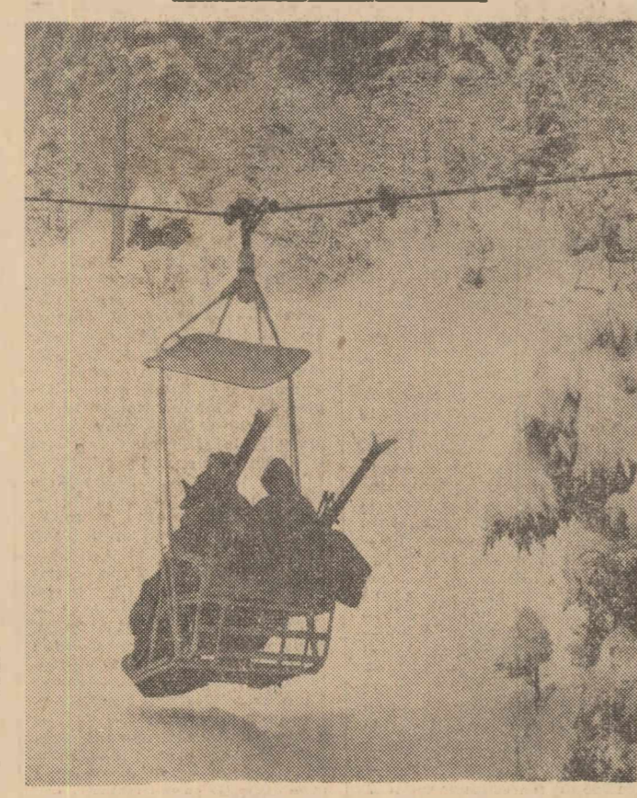
Cu telefericul spre Cristianul Mare

Ei invocă drept argument principal posibilitatea unor măsuri „bumerang” din partea altor guverne. Iar, în numele opoziției conservatoare, Reginald Maudling s-a asociat acestor critici, invitîndu-l pe ministrul de finanțe să-și precizeze intențiile. La rîndul lor, cercurile guvernamentale au încercat să minimalizeze im-