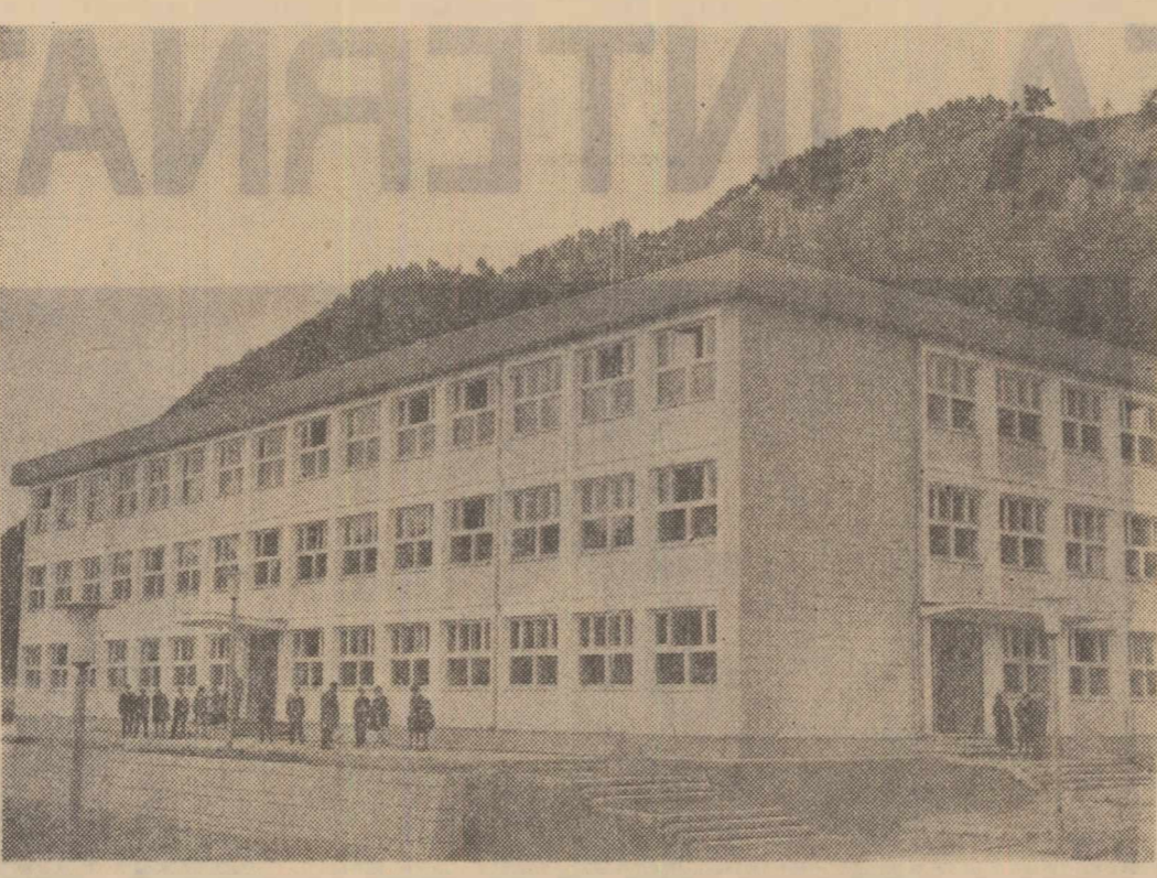
Conducerea instalațiilor moderne cu care sînt înzestrate noile uzine și combinate chimice de pe Valea Bistriței necesită muncitori cu o înaltă pregătire, buni cunoscători ai proceselor tehnologice, stăpîni pe tehnica nouă. Pentru pregătirea lor, odată cu deschiderea anului școlar, la Fărața Neamț a luat ființă un nou grup școlar chimic — a treia unitate de acest fel din regiunea Bacău. În cadrul acestui funcționează o școală profesională, care pregătește operatori chimici, mecanici de utilaje chimice, lucrători și electricieni pentru nevoale Uzinei de fibre și fibre sintetice și ale Combinatului de îngrășăminte cu azot Fărața Neamț, o școală pentru pregătirea personalului tehnic, precum și o școală de maștri. În clișeu: Noul local în care funcționează centrul școlar chimic.