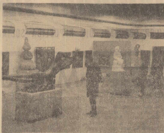
Aspect de la Expoziția de pictură și sculptură a orașului București

O modalitate literară sau alta nu este bună sau rea în sine, critica literară curentă trebuie să țină seama însă de vocația fiecărui scriitor, în parte, mai ales cînd acesta este începător. Cred a lui Constantin Toiu mai ales calitatea de analist.