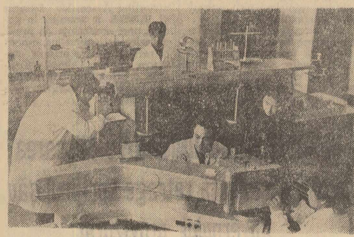
Studentii ai Universității din Phenien, într-unul din modernele laboratoare cu care este inzestrată această instituție de învățămînt superior din capitala R.P.D. Coreene

DONETK 5 (Agerpres). — Specialiștii ucraineni au proiectat primul excavator cu rotor din U.R.S.S. cu o capacitate de producție de 1000 tone pe oră pentru extragerea cărbunelui. Noua mașină are înălțimea unei case cu patru etaje, este prevăzută cu un rotor cu cupe, cu ajutorul cărora ea extrage cărbunele în flux continuu și îl încarcă în vagoane de cale ferată, prin intermediul unui transportor.