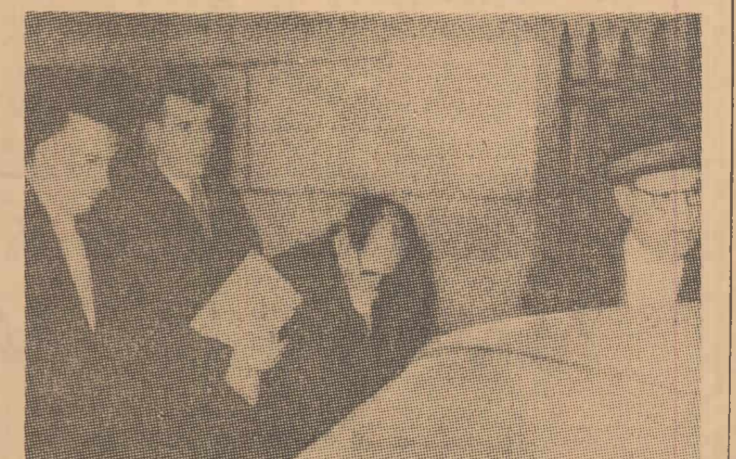
Recent a fost descoperită o vastă rețea de traficanți de stupefiante, implicată într-o afacere de droguri în valoare de 18,5 milioane dolari. O parte a membrilor bandeii — patru cetățeni francezi, un brazilian și un ofițer american — au fost arestați în Statele Unite. Un alt american, de asemenea fost ofițer la o bază militară a S.U.A. din Orleans, a fost arestat în Franța. Iată, în fotografie, pe trei din membrii bandeii — în momentul arestării lor la New York.

DAMASC 27 (Agerpres). — Salah Bitar, însărcinat cu formarea noului cabinet, a continuat în cursul zilei de luni consultările în vederea declinării listei. Potrivit declarației sale, el speră să prezinte președintelui Hafez lista completă a guvernului în următoarele 48 de ore. Generalul Mohammed Omrane, fost vicepreședinte al Consiliului de Miniștri, care în prezent îndeplinește funcția de ambasador al Siriei la Madrid, a fost rechemat de urgență la Damasc pentru a fi consultat în vederea constituirii Cabinetului.