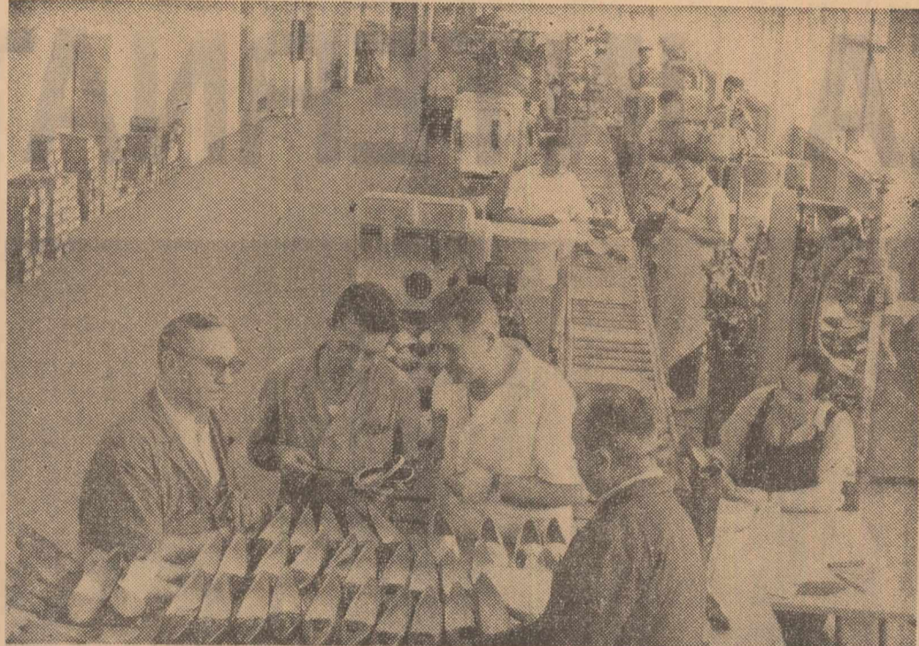
Fabrica de încălțămînte „Progresul” din capitală a intrat în producție în acest an cu întreaga capacitate a noilor sale secții. Dotată cu mașini și utilaje moderne, fabrica realizează un înalt grad de productivitate a muncii. În clipă: Un aspect din secția de creație a fabricii „Progresul” care în acest an a realizat 315 noi modele de încălțămînte pentru femei. Peste 100 din aceste modele sînt creații pentru sezonul rece

kiene situate pe înălțimile munților Harir au semnalat o mișcare a răscolitelor kurzi dincolo de frontierele irakiene. O caravană de catiri era în mișcare. Se presupunea că ea transporta arme și alimente spre tabăra forțelor răscolite. Prezența acestei caravană ne a fost anunțată de comandamentul de sector și apoi cartierului general al celei de-a doua divizii de la Kirkuk. În momentul cînd s-a stabilit precis destinația pe care o avea caravană, s-a dat ordinul de intrare în acțiune a aviației.”