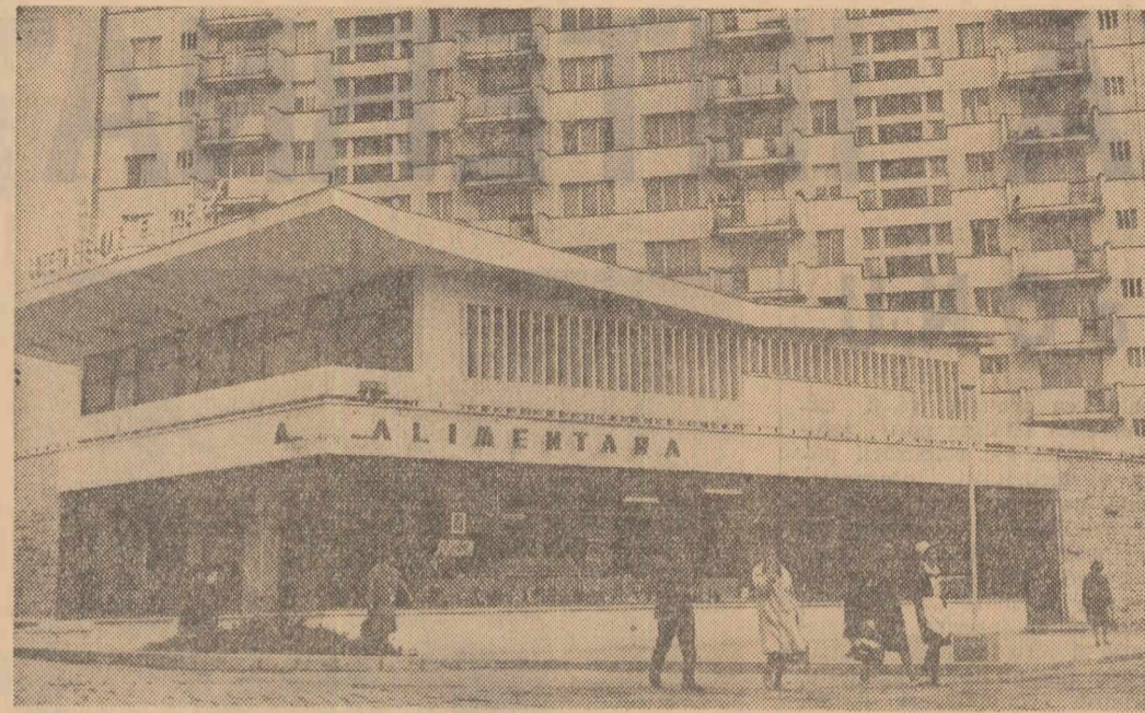
Unul din noile complexe alimentare din orașul Piatra Neamț