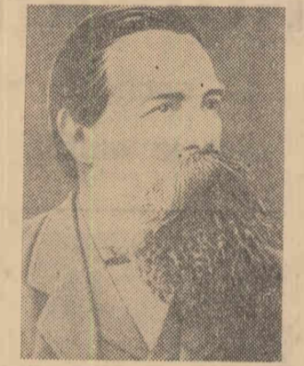
Engels, cițiva devenind ei înșiși detractori.

Cercetările din ultimii douăzeci de ani intrinsec de istoric, economic, literar și filozofic ne-au permis să cunoaștem numeroase fapte și date în legătură cu influența mereu crescândă pe care a exercitat-o teoria marxist-leninistă în lupta de eliberare socială și națională a poporului român. S-a acumulat un mare număr de fapte și cu privire la aspectul mai particular al marxismului în România și anume influența asupra procesului de dezvoltare a filozofiei. Rezultatele obținute impun cu tot multă putere ideea că am ajuns la stadiul în care se pune cu necesitate un pas calitativ nou pe acest tărâm. În prezent, cine își propune să examineze influența marxismului asupra filozofiei românești nu poate să nu tină seama de câteva laturi principale: modalitatea și intensitatea răspîndirii operelor lui Marx și Engels; reacția filozofilor români față de marxism în general, față de materialismul dialectic în particular; influența filozofiei marxiste asupra concepției românești; cum a fructificat materialismul dialectic opera teoretică a celor mai de seamă oameni de cultură din țara noastră; în ce fel de vechi concepția marxistă despre lume dominantă în rîndurile poporului român.