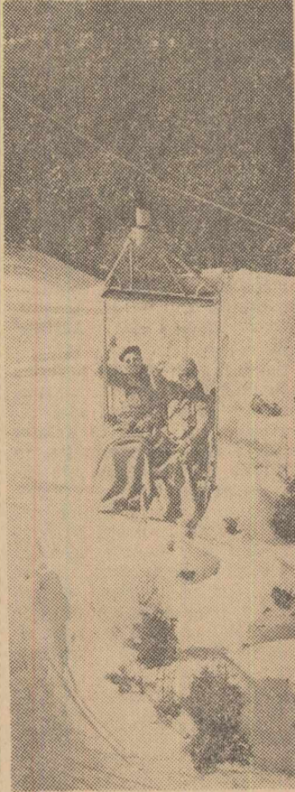
Zăpada a poposit de mult în munți, dar iubitorii sportului de iarnă deabia de acum încolo încep să se sosească în număr mare. La Poiana Brașov, primii schiori crește cu telefericul spre urechile înzăpezite ale Postăvarului.

Formarea viitoarelor cadre de ingineri trebuie să asigure în același timp o pregătire complexă, un profil larg. Profilul învățămîntului este legat de specializarea care i se asigură absolventului. Dacă fiind durată limitată de studiu și ținînd seama de dezvoltarea complexă a științei și tehnicii în etape imediat următoare absolvirii, opinăm nu pentru o ultraspecializare, ci pentru o pregătire temeinică, bazată pe dis-