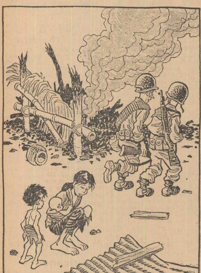
Acest desen, reprodus după ziarul Washington Post, a apărut ca o reacție la știrea că unitățile americane în căutarea unităților forțelor patriotice, au distrus din nou „din greșeală” un sat sud-vietnamez. Desenul este însoțit de următorul text: „Cum să le explicăm că sintem de partea lor?”

OSLO 11 (Agerpres). — „Norvegia nu va participa la viitoarea intrunire a miniștrilor apărării din țările-membre ale N.A.T.O., care va avea loc pe data de 27 noiembrie la Paris” — se anunță în comunicatul dat publicității de Ministerul Afacerilor Externe al Norvegiei. Această hotărîre se adaugă în comunicat — nu va avea repercusiuni asupra poziției Norvegiei față de Pactul atlantic. „Guvernul norvegian își rezervă, de altfel, dreptul de a fi reprezentat ulterior la viitoarea comitetă”.