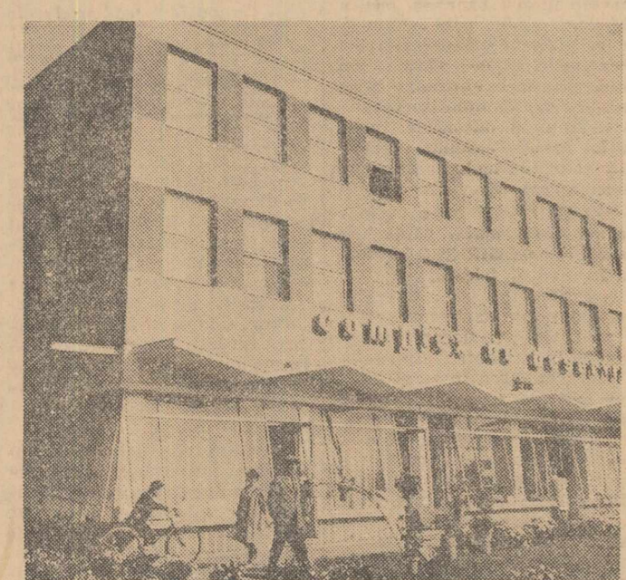
Zeci de moderne complexe cuprînzînd unități pentru diverse prestări de servicii au fost date în folosință numai în cursul acestui an. În cîleșu: Unul dintre aceste complexe deschis în orașul Călașrași

Din această cauză nu putem răspunde corespunzător urgențelor. Primim zilnic adevărate grămizi de telegrame de urgență, dar uzinei îi vine foarte greu să aprecieze unde „arde” mai mult. Din acest punct de vedere baza ar putea