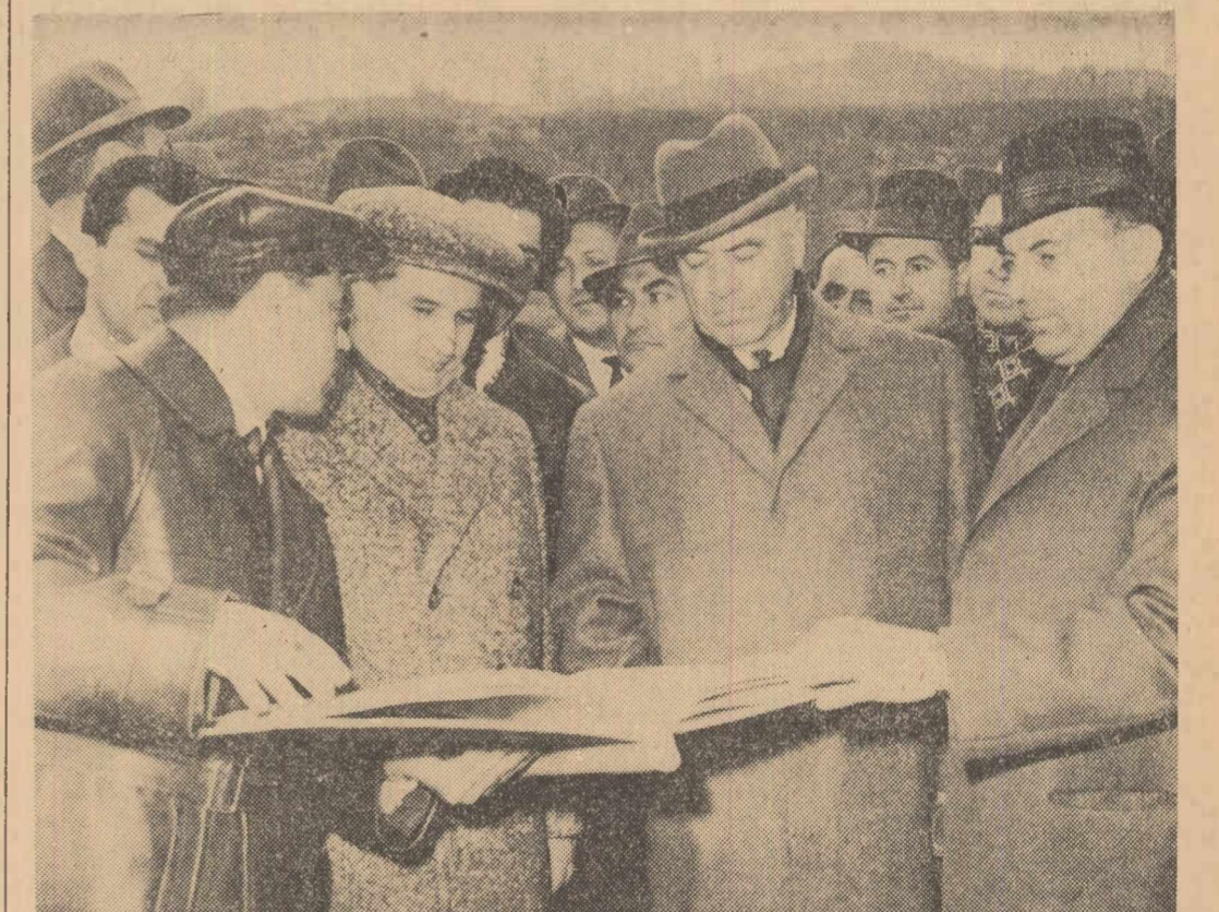
La barajul de pe riul Firiza