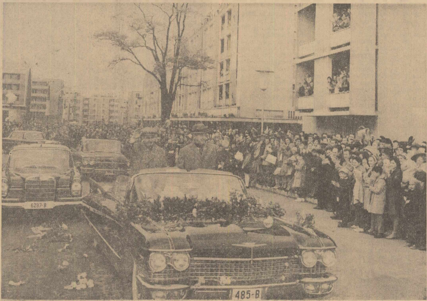
Pe străzile orașului Baia Mare, populația face o călduroasă primire conducătorilor de partid și de stat