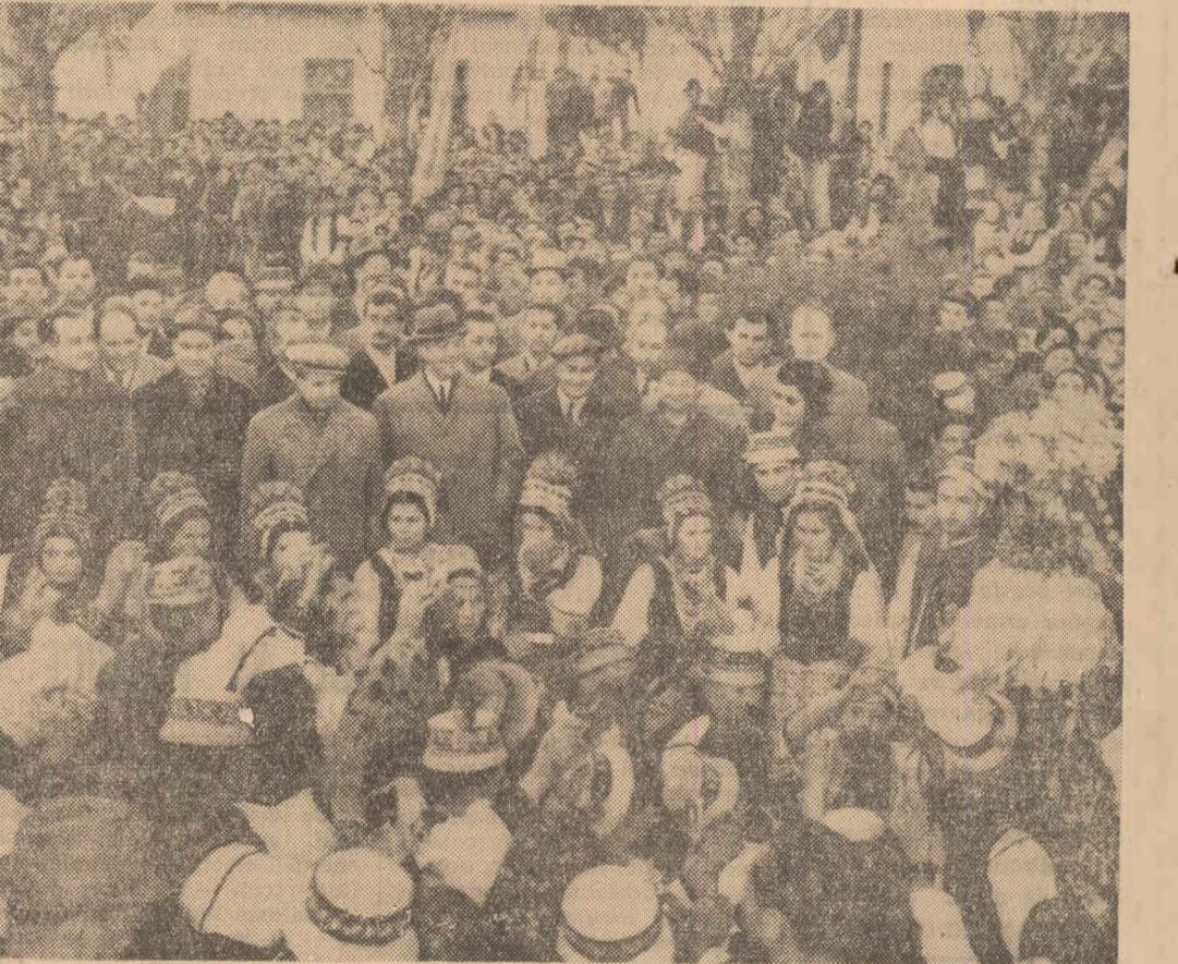
În orașul Negrești, din Țara Oașului