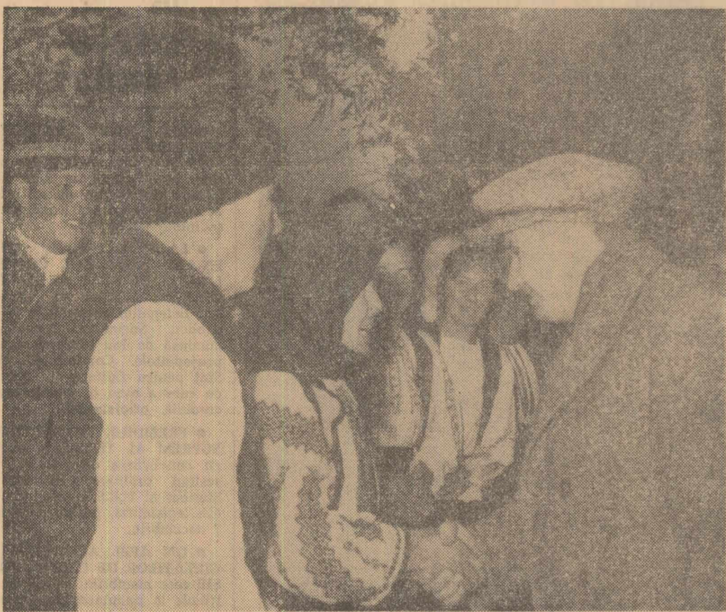
La cooperativa agricolă de producție „Scinteia” din comuna Luna