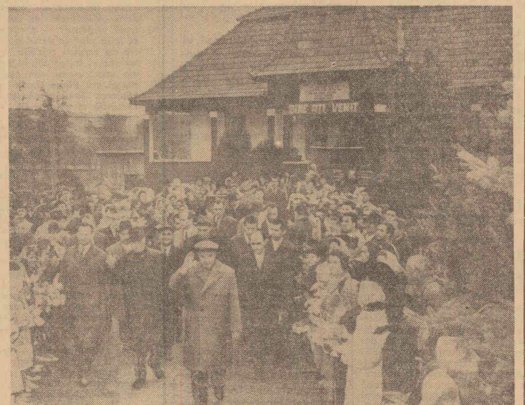
La cooperativa agricolă de producție „Arieșul” din comuna Mihai Viteazu