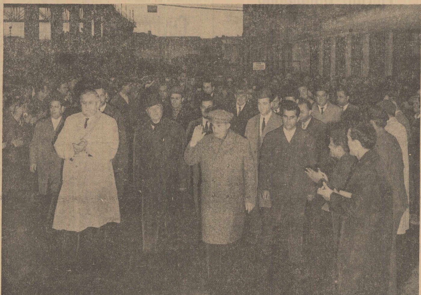
În vizită la uzinele „Industria sirmei” din Cimpia Turzii

ansamblul științei și culturii din țara noastră. Vorbitorul a scos în evidență preocuparea cadrelor care lucrează în acest centru universitar pentru ridicarea nivelului învățămîntului și al cercetărilor științifice pe o treaptă din ce în ce mai înaltă, pentru sporirea contribuției lor la realizarea programului trasat de Congresul partidului. Mersul înainte,