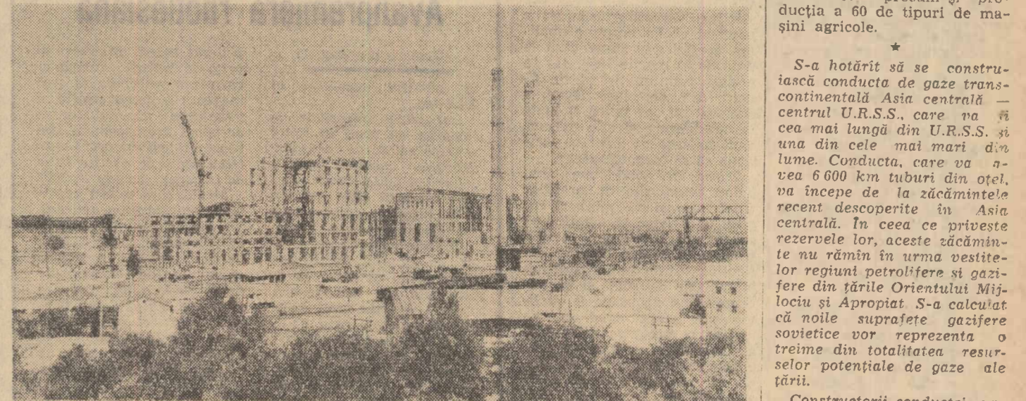
Lingă Slaveansk, în Donbas, se construiește un nou corp pentru agregatul cu o putere de 800 000 kW, cel mai mare din Uniunea Sovietică. Agregatul cuprinde un cazan cu o capacitate de 2 500 tone de abur pe oră, o turbină și două generatoare. Agregatul unit va fi mai economic decât multe termocentrale în funcțiune și va consuma cu o treime mai puțin combustibil convențional pentru producerea unui kilowat-ora. În fotografie: Centrala electrică Slaveansk și corpul care se construiește alături de ea pentru puternicul agregat.

Ca rezultat al îmbunătățirii tehnologiei și automatizării exploatarea petroliferă, în R.S.S.A. Tătară creșterea anuală a extracției de țeft trece de cinci milioane de tone. Aproape o treime din sondele în funcțiune au fost trecute la telecomandă. În unele sectoare, operatorii controlează funcționarea sondelor numai o dată în 24 de ore, iar restul timpului procesul de extracție este urmărit de dispozitive automate. La exploatarea din republică au fost date în funcțiune cinci grupuri de aparatură pentru telemecanizare, care se bazează pe sistemul frecvențelor. La acestea s-au racordat peste 500 de sonde, două puncte de acumulare a șteiului și cîteva stații de pompare. Un serviciu de dispeceri conectează și deconectează de la distanță echipamentul sondelor. Aparatele semnalează orice defecțiune din orice punct al exploatarea.