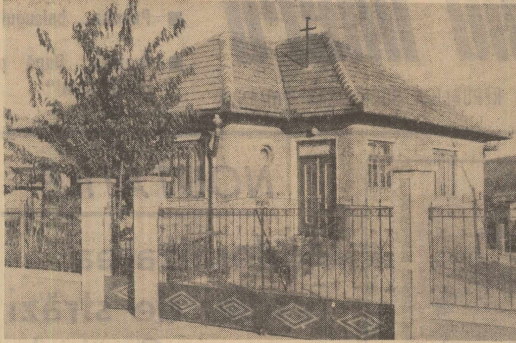
Casă fărănească din regiune construită după proiectele D.S.A.P.C.-Cluj