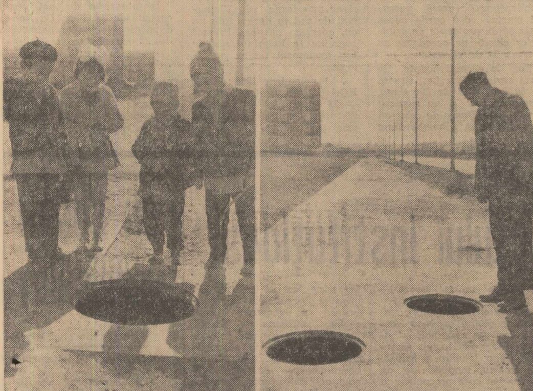
Figlina II, noul cartier din Galați, impresionează prin frumusețea blocurilor ce s-au înălțat aici. E periculos să privești însă prea atent la construcții fără să te ulei și pe unde calci. Când o neglijență condamnăbă la un lucrător al întreprinderii de construcții orașenești Galați a făcut ca nenumărate guri de canal să rămână fără capac. Unele din aceste canale se află chiar pe trotuar, așa cum se vede și în fotografiile de mai sus, surprinse pe B-dul Siderurgiștilor. Comentariile sînt inutile.