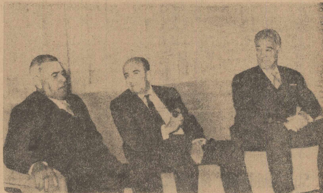
În timpul vizitei la primul ministru al Iranului

TEHERAN 22 — De la trîmbiții speciale: Ziua de vineri — duminică iraniană — a oferit oaspeților români prilejul vizitării unor locuri pitorești din jurul Te-