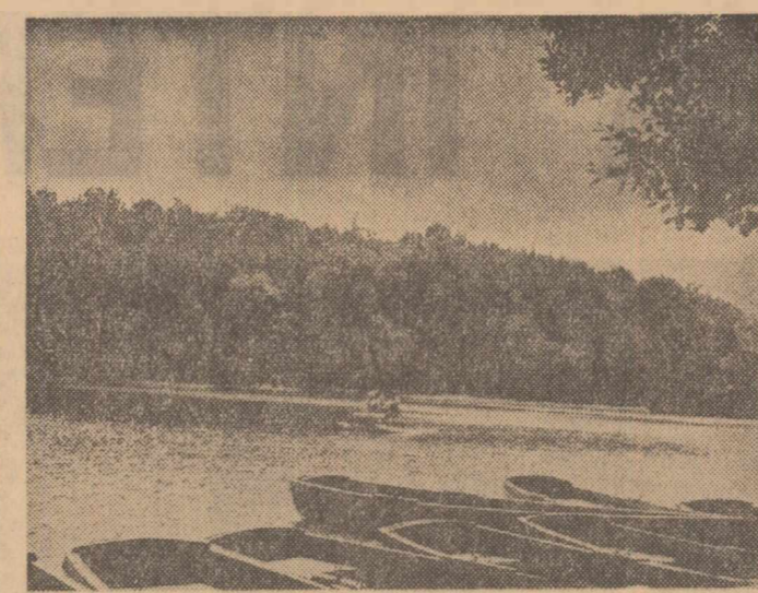
In Dumbrava Sibului

Se știe că ghișeele unor întreprinderi cum ar fi I.L.T. sau I.R.E.B. sînt în general aglomerate. Orice cetățean