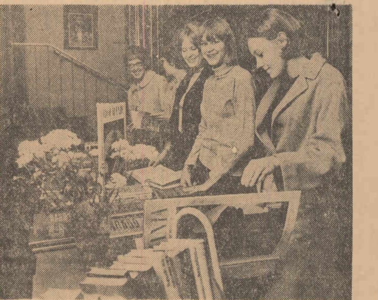
Vizitatori ai Expoziției cărții românești deschisă la Universitatea Uppsala din Suedia.