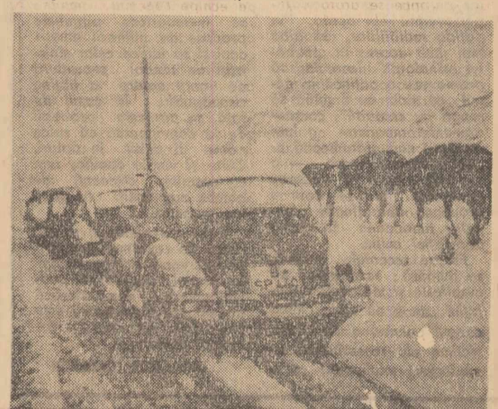
Larna imatură și-a făcut apariția în Alpii alveieni. Zăpada și gheața i-a surprins atît pe turiști cît și vitele care se aflau pe munte. În fotografie: Un aspect de la Gotthard Pass.

Nava va putea începe navigația în luna decembrie. Ea va efectua oț curs pe an în regiunea golfului Persic.