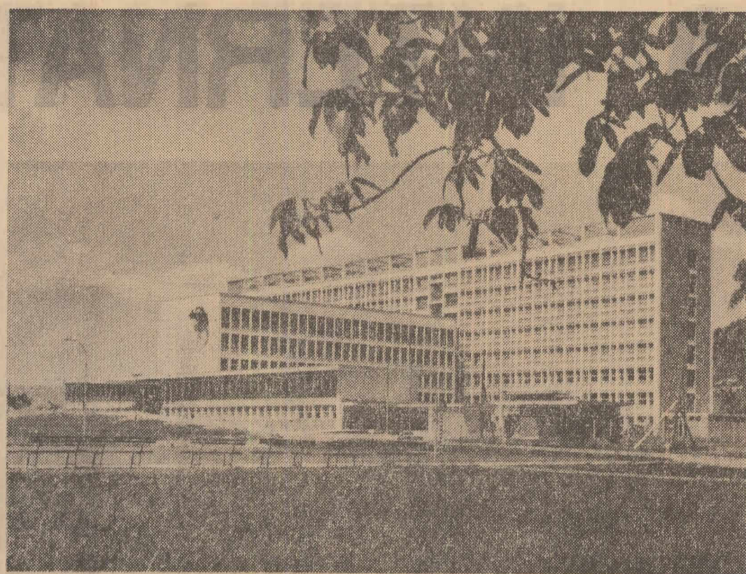
În orașul Gheorghe Gheorghiu-Dej s-a dat în folosință unul dintre cele mai moderne și mai bine dotate instituții spitalicești din țară