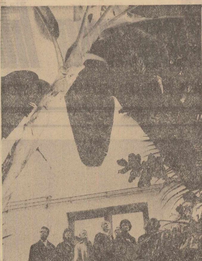
Vizitatori în sera palmerilor și bananierilor din Grădina botanică din Cluj

În cadrul conferinței vor fi dezbătute peste 200 de comunicări științifice. Dintre acestea, 120 au fost tipărite în extenso în limba română și germană, cu rezumate în limba rusă, fiind distribuite participanților. Restul comunicărilor, împreună cu o dare de seamă asupra desfășurării lucrărilor, vor fi tipărite după conferință. S-au pregătit, de asemenea, broșuri privind activitatea desfășurată la Timi-