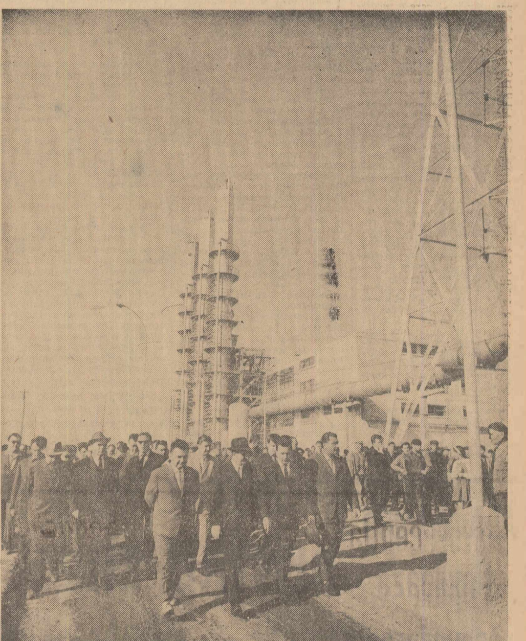
La Combinatul de îngrășăminte azotoase

Specialiștii combinatului arată că se apropie de sfîrșit lucrările la centrala energetică pentru tratarea apei și obținerea aburului care va asigura intrarea în probe a fabricilor de acid azotic și azotat de amoniu; în luna octombrie, cu două luni mai devreme față de prevederile planului, se vor obține astfel primele cantități de îngrășăminte chimice. La Fabrica de oxigen a intrat în rodaj primul turbocompresor, urmînd ca în luna noiembrie să înceapă producția de oxigen și azot. Instalațiile fabricii de amoniac vor fi terminate pînă la sfîrșitul acestui an și, o dată cu terminarea probelor tehnologice la instalațiile de conversie a metanului și de purificare a gazelor, vor fi obținute primele cantități de amoniac. Chimiiștii, operatorii, laboranții, mecani-