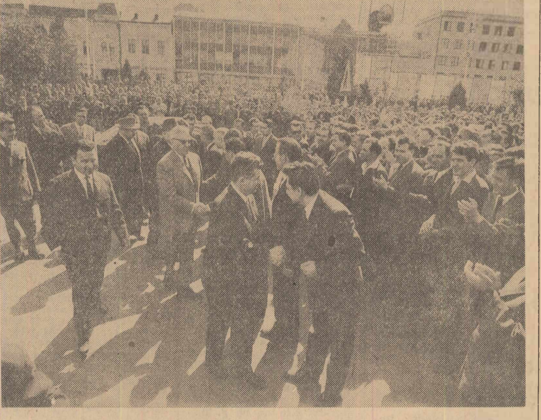
Cetățenii orașului Tg. Mureș salută cu căldură pe conducătorii de partid și de stat.

La un simplu apel telefonic stația transmite prin cablu datele în morse. Ea poate fi dotată și cu un bloc de comandă program transmisînd astfel datele și prin radio.