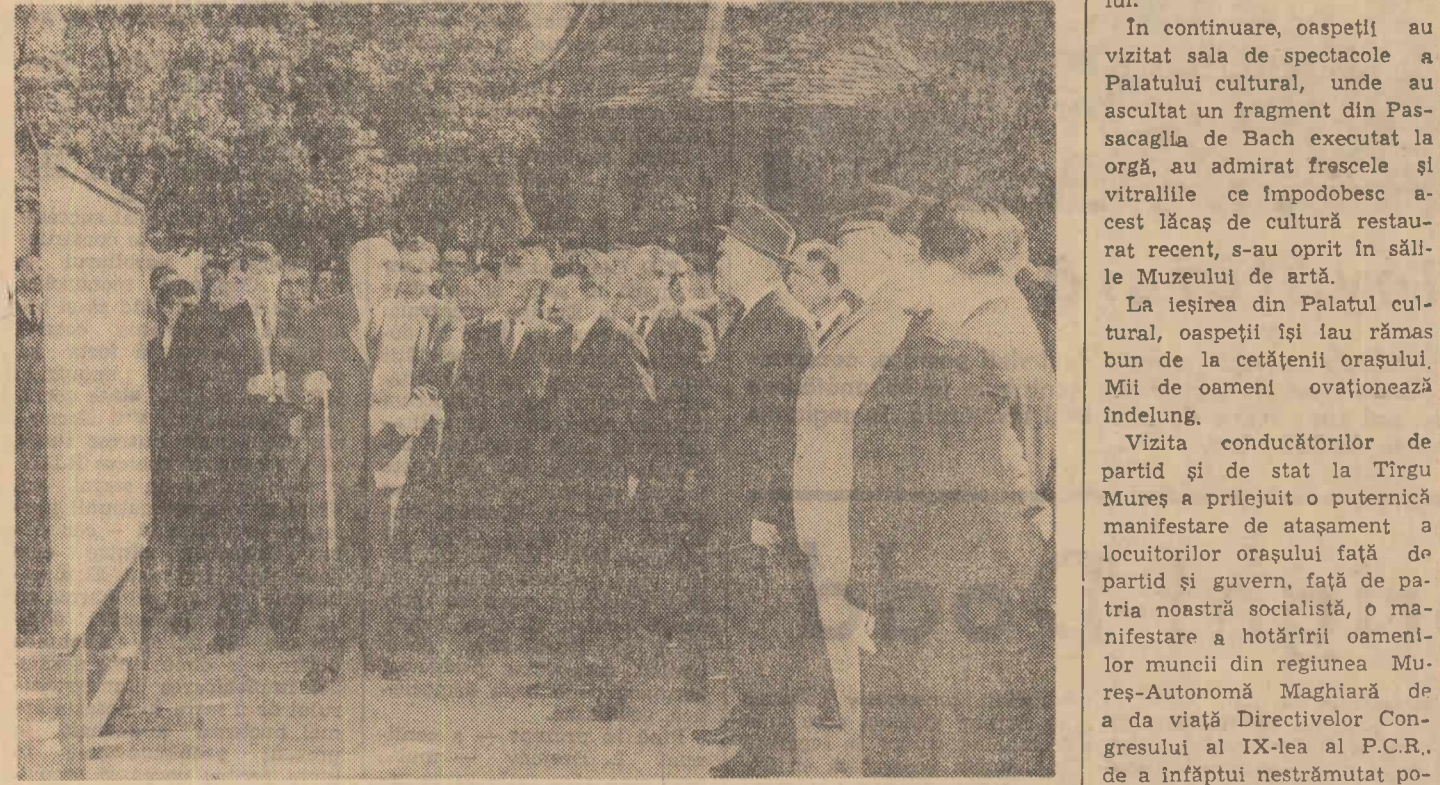
În parcul Harghita, acolo unde va fi amplasat noul teatru

Conducătorii de partid și de stat străbat apoi vasta și luminoasă piață a trandafirilor prin mijlocul unei mari mulțimi de oameni care a-