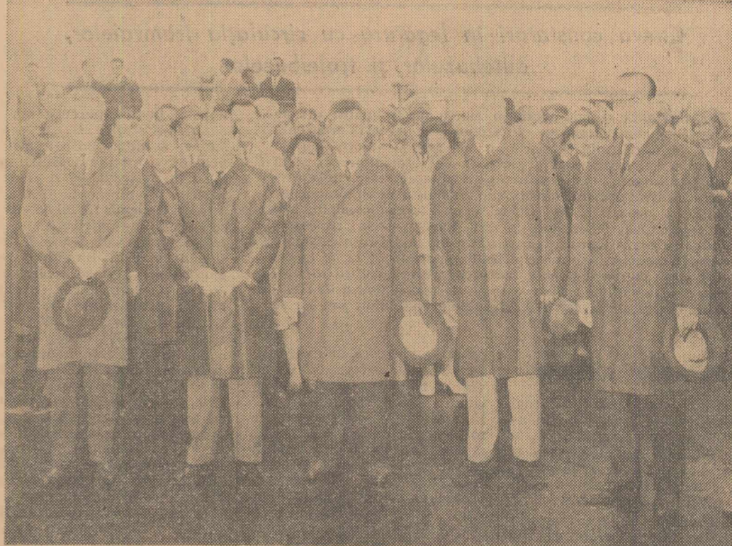
La plecare, pe aeroportul Băneasa