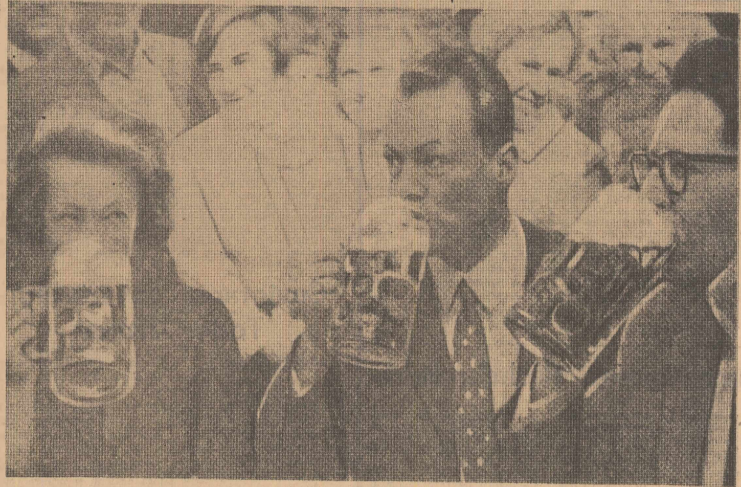
„Halba de bere, argument preelectoral”

Sub acest titlu, ziarul Le Figaro publică fotografia de mai sus, în care apare liderul partidului social-democrat de opoziție din R.F.G. Willy Brandt, la o întrunire electorală. Precum se vede, primarul Berlinului de vest, epui-zînd argumentele de ordin politic și economic, din cauza asemănării izbitoră între programele P.S.D. și U.C.D. și în căutarea unui simbol popular cu care să se identifice, a recurs la un argument lichid — tradiționala băutura locală, berea. Avînd în vedere ceea ce observatorii din R.F.G. numesc „depolitizarea” actualei campanii electorale, este de așteptat ca partidul rival să dea replica adecvată. Cele două partide principale care-și dispută puterea au ajuns, printre altele, să-și reproșeze, potrivit relațiilor unei agenții de presă, chiar și numărul de accidente de automobil.