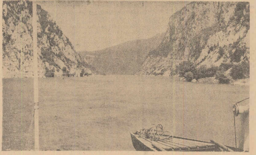
Dunărea la Cazane