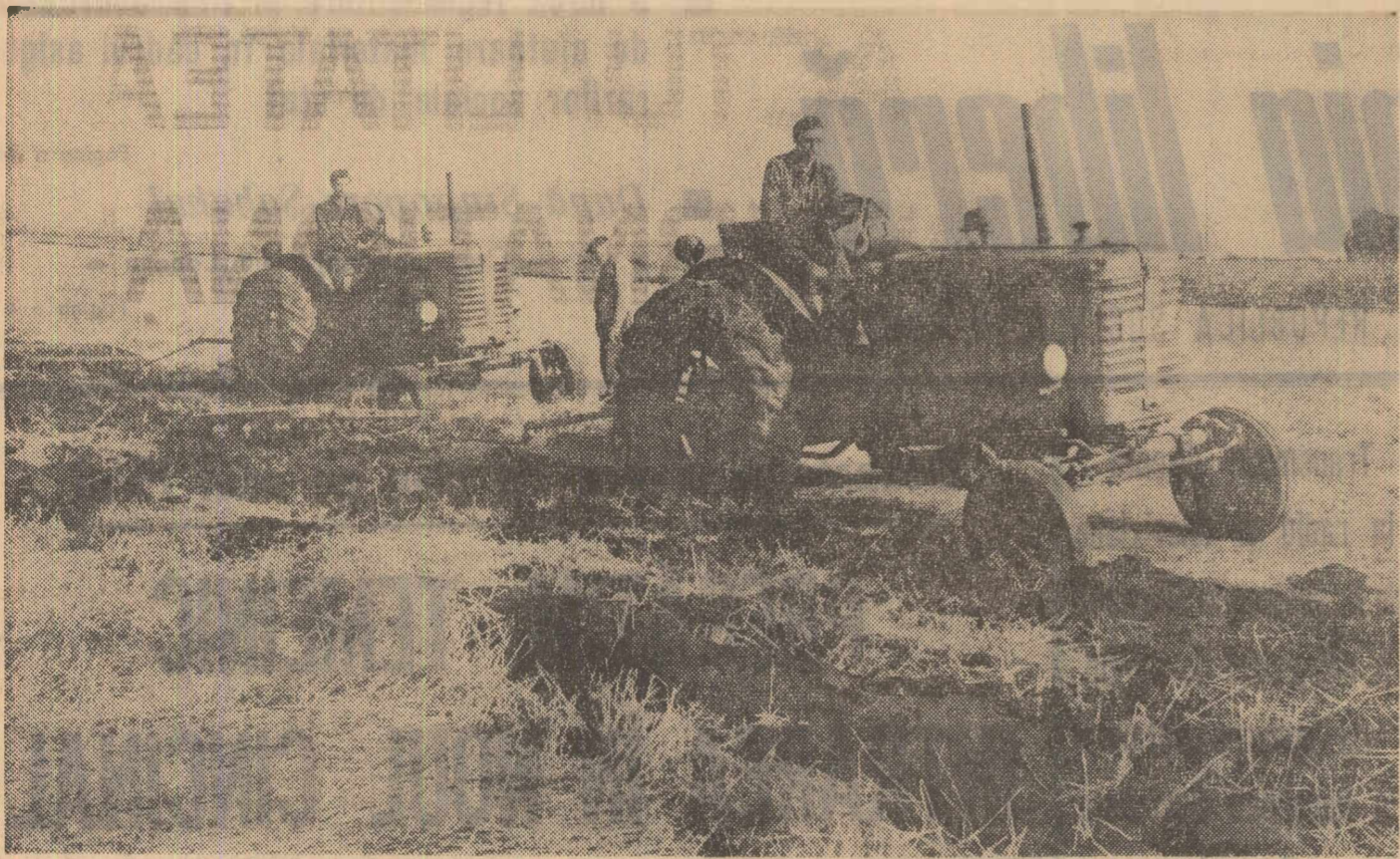
O imagine caracteristică pentru lucrările care se execută în prezent pe ogoare. La gospodăria agricolă de stat Strunga, regiunea Iași, mecanizatorul grăbesc executarea arăturilor.