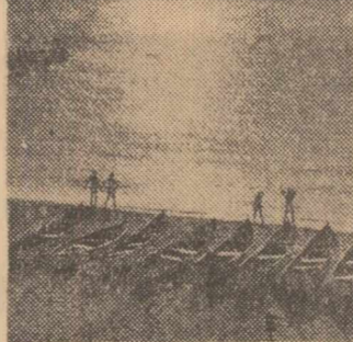
Răsărit de soare pe litoral.