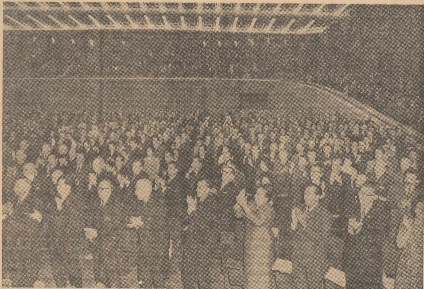
Aspect din sală

Dar ar fi incomplet, dacă nu ne-am pătrunde în chip foarte adînc, de ideea că, la rîndul ei, această plenitudine de drepturi implică un ascuțit simț al datoriei, fără de care, de altfel, nici nu-și va putea da roadele. Fiecare cetățean al statului nostru — a spus vorbitorul — trebuie să-și înalțe conștiința sa pe o nouă treaptă a devotamentului, a dragostei, a credinței față de patrie și a credinței față de partid, prin hotărîrea și angajamentul de a munci mai bine, de a face noi eforturi, de a nu preocupă nici o strădanie și nici un sacrificiu în slujba poporului și a societății noastre socialiste. Aci trebuie să mă refer la calitatea mea profesională de scriitor, de membru al frontului literar și artistic — unul dintre aceia care cu atîta mîndrie s-au auzit numiți de către tovarășul secretar general al C.C. al P.C.R. Nicolae Ceaușescu în raportul tinut în fața Congresului al IX-lea, „participanți activi la opera de construire a socialismului”. În statul socialist, în societatea socialistă, rolul literaturii va fi încă și mai important decît pînă acum. Literatura joacă un rol urias în formarea și dezvoltarea omului — înainte cu mult de a merge la școală, de a învăța alfabetul și tabla înmulțirii, orice copil știe o mulțime de basme, de poezii și de cîntece, are o conștiință