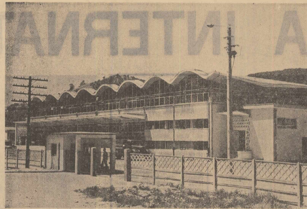
Lingă Petrogeni s-a inaugurat de curind o nouă și modernă fabrică de produse lactate. Avînd o capacitate de prelucrare de 50 000 de litri lapte zilnic, noua fabrică produce o largă gamă de produse lactate ca: iaurt, lapte băut, smîntînă, frișcă, brînză, unt etc. În cîșeu: un aspect exterior al noii fabrici

Noua policlinică e prevăzută să intre în funcțiune la începutul anului viitor. La ora actuală, clădirea afectată micilor pacienți e supusă ultimelor finisări, iar la corpul central, se execută tencuielile interioare și pardoselile și se montează timplăria.