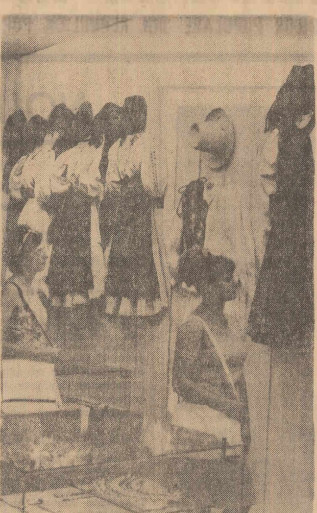
O expoziție specială deschisă în Capitală caută să redea ceva din frumusețea artei populare maramureșene. Foto-reporterul nostru Nicu Vasile a surprins un moment din timpul vizitelor