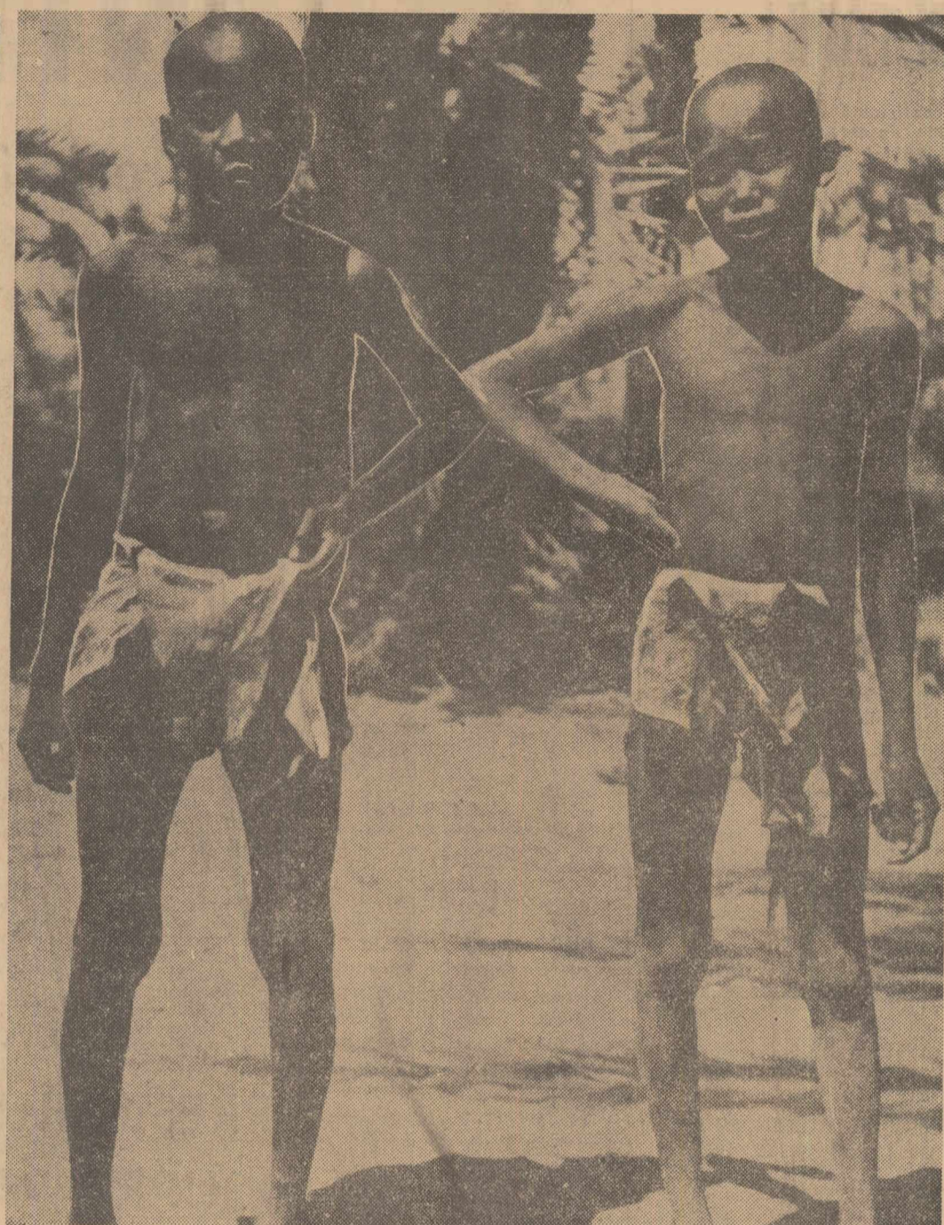
În loc de monetă Cei doi tineri, care au fost fotografiați pe furii de un reporter al revistei belgiene „Le Soir illustré”, făceau parte dintr-un grup de sclavi care de obicei însoțesc, în chip de monetă de schimb, pe stăpînii lor în lungile pelerinaje prin Sahara, Niger, Ciad sau Sudan (citiți amănunțe în corespondența de mai jos din Geneva). La un loc, ei valorează pe piața sclavilor o sumă echivalentă cu 5600 lei

BELGRAD 31 (Agerpres). — Lal Bahadur Shastri, primul ministru al Indiei, a părăsit Belgradul, încheindu-și vizita oficială în R.S.F. Iugoslavia. În cadrul unei conferințe de presă, care a avut loc înainte de plecarea, primul ministru al Indiei și-a exprimat satisfacția în legătură cu dezvoltarea relațiilor dintre Iugoslavia și India, amintind că a fost încheiat un acord cu privire la lărgirea comerțului dintre cele două țări. Ambele țări, a declarat Shastri, doresc ca relațiile economice să se extindă și să se dezvolte și mai mult și vor face totul în acest scop. Shastri a afirmat că problema Vietnamului a fost una dintre cele mai importante probleme discutate în cadrul convorbirilor iugoslavo-indiene. Ambele țări, a declarat el, și-au exprimat dorința de îmbunătățire a situației din această parte a lumii în interesul păcii și consideră că trebuie să înceteze bombardamentele asupra R. D. Vietnam.