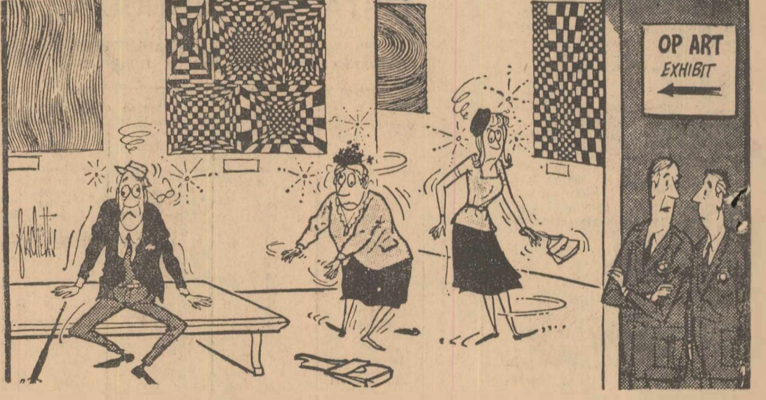
— Ți-aduci aminte de vremurile de altădată, cînd se spunea că artistul suferă de pe urma procesului de creație? Desen apărut în „New York Herald Tribune” cu prilejul deschiderii unei expoziții moderniste „Op-Art” la New York.

ceritorilor? Acum straiul ei zornăitor s-a destrămat! Plată bună și mincare bună, senzații tari și viață tîndră! Aventură și camaraderie! Asta-i tot ce-a rămas. În fond, indiferent de maniera apelului, el s-a adresat întotdeauna aceluiași aventurier, celor care se simt frustrați de legile „vieții civile”. Acești supermani sînt chemați, parcă, la o croazieră. Vor vedea mai tirziu în ce măsură realitatea este așa. Ei pot fi înfîptuiți de moarte nu numai de senzații tari, tocmai pentru că popoarele asuprite au învățat să riposteze cum se cuvine.