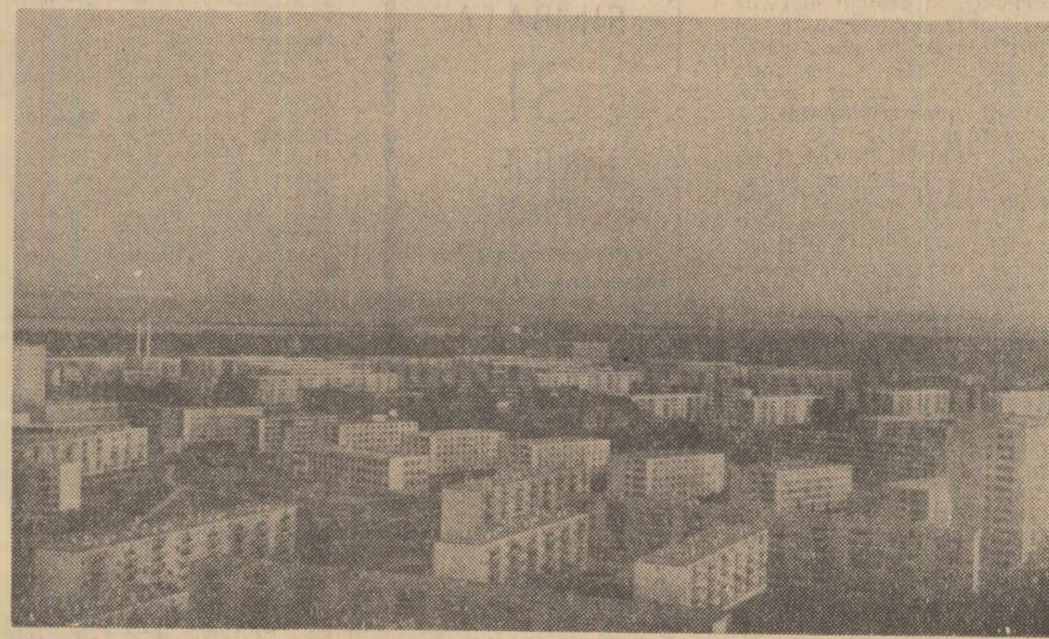
Aspect din Galațiul de azi: cartierul Țiglina

COMITETUL CENTRAL AL PARTIDULUI COMUNIST ROMÂN