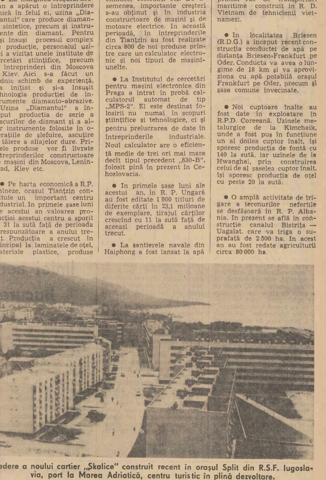
Vederea a noului cartier „Skalice” construit recent în orașul Split din R.S.F. Iugoslavia, port la Marea Adriatică, centru turistic în plină dezvoltare.

● Timpul este înaintat și orice întîrziere înseamnă pierderi de recoltă. Conducerea unităților agricole, ale S.M.T.-urilor, cu sprijinul consiliilor agricole, trebuie să ia de urgență toate măsurile pentru ca recoltarea să se termine în cel mai scurt timp.