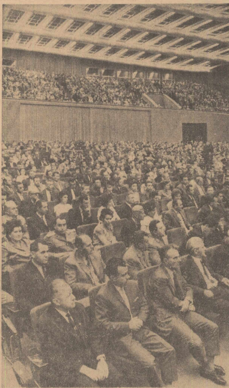
Aspect din timpul lucrărilor Congresului

În cursul sedințelor de dimineață ale Congresului au rostit cuvîntări de salut tovarășii Haled Bagdas, secretar general al Partidului Comunist Sirian; Virginia Gonzales, membru al Comitetului Central al Partidului Comunist din Chile; Layachi Abdallah, membru al Biroului Politic și secretar al Comitetului Central al Partidului Comunist Marooan; Per Swensson, secretar al Comitetului Central al Partidului Comunist din Norvegia; Kyriakos Hristu, membru al Biroului Politic al Comitetului Central al Partidului Progresist al Poporului Muncitor din Cipru; conducătorul delegației Partidului Comunist din Liban; Jose Luis Massera, membru al Comitetului Executiv al Comitetului Central al Partidului Comunist din Uruguay; Oka Masayoshi, membru al Prezidiului și Secretariatului Comitetului Central al Partidului Comunist din Japonia; Hussein Khallaf, ministrul relațiilor culturale cu străinătatea al Republicii Arabe Unite, secretar pentru ideologie și orientare în Uniunea Socialistă Arabă; Gösta Jahansson, membru supleant al Biroului Politic al Comitetului Central al Partidului Comunist din Suedia; Vincenzo Ansanelli, membru al Direcțiunii Partidului Socialist Italian al Unității Proletare; Dominique D. Urbany, președintele Partidului Comunist din Luxemburg; Roger Dafflon, secretar al partidului, membru al Comitetului Director al Partidului Muncii