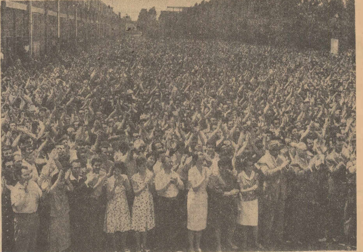
La adunarea de la Uzinele „1 Mai” - Ploiești

Realizările obținute pe calea construcției socialismului, înfăptuirea sarcinilor mari pe care ni le propunem în următorii ani reprezintă o contribuție a poporului nostru la cauza socialismului și păcii în lume, monstrează superioaritatea orînduirii socialiste, forța creatoare a clasei muncitoare, a poporului stăpîn pe soarta sa. (Aplauze puternice). Tovarăși, Evenimentele internaționale demonstrează creșterea continuă a