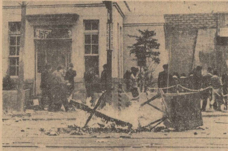
În cursul unor recente demonstrații studentești din Coreea de sud, un grup de studenți din Seul a dat foc unei gherete de poliană, în semn de protest împotriva violenței cu care poliția sud-coreeană reprimă demonstrațiile.

În ședința de miercuri a Consiliului O.S.A., membrii Comisiei speciale care s-a înapoiat din Republica Dominicană au prezentat un raport în care subliniază că „evenimentele care s-au produs în această țară nu le-au permis să ducă la îndeplinirea misiunii ce le-a fost încredințată” privind respectarea încetării focului. Între timp, la Santo Domingo continuă luptele între trupele generalului Imbert Barreras și forțele constituționaliste ale colonelului Caamaño.