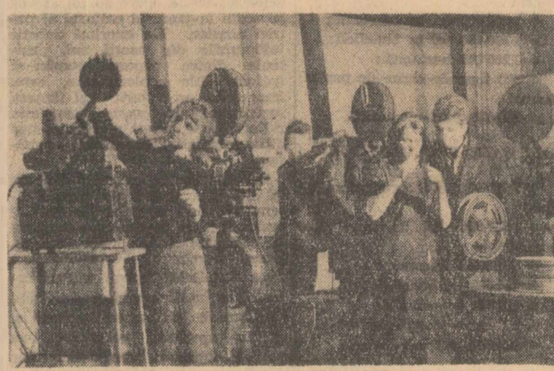
Scoala tehnică de cinematografie din Capitală pregătește cadre de tehnicieni pentru rețeaua cinematografică din țară.