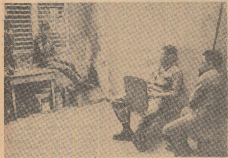
Doi militari americani (în prim plan) luați prizonieri și ținuți sub pază la cartierul general al armatei forțelor constituționaliste din Santo Domingo.