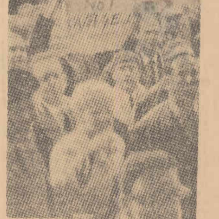
Aspect de la o demonstrație revendicativă a muncitorilor din industria construcțiilor din Londra. Pe lozincă ridicată de unul din participanți la manifestație stă scris „Înghetați profiturile, nu salariile”.

● Celebră operă a pictorului flamand Jen van Schoorel „Agata Schoenhoven”, evaluată la 80 milioane lire și care a fost sustrasă la 16 mai de la muzeul Doris Pamphilii din Roma, a fost restituită de autorul furtului. (Ag.)