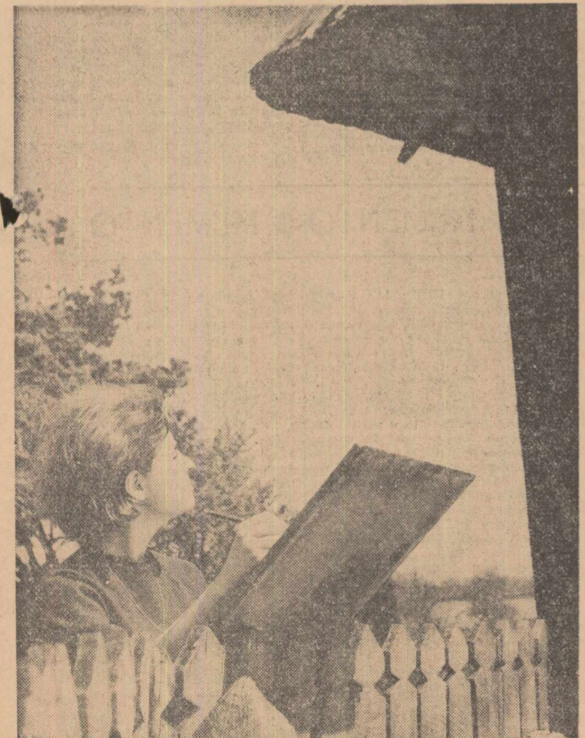
Motiv de inspirație. Cu planșa de desen la Muzeul Satului.

Traseele turistice pe care se vor găsi asemenea posibilități de cazare sînt în număr de 12: Bors — Oradea — Cluj — Sibiu — Brașov — București; Cluj — Turda — Tg. Mureș — Sovata — Odorhei — Miercurea Ciuc — Brașov; Sibiu — Rim. Vilcea — Pitești — București, Brașov — Bran — Cîmpulung Muscel — Pitești; Brașov — Tg. Secuilesc — Orășul Gheorghe Gheorghiu-Dej; Timișoara — Turnu Severin — Craiova — Pitești — București; Timișoara — Arad — Deva — Sibiu; Siret — Suceava — Bacău — Buzău — Urziceni — București; Suceava — Cîmpulung Moldovesc — Vatra Dornei; Suceava — Tirgu Neamț — Piatra Neamț — Bicaz — Bacău; Măreșești — Tecuci — Galați — Brăila — București și Constanța — Tulcea. Aceștia li se adaugă, așa cum s-a menționat, stațiunile balneo-climaterice.