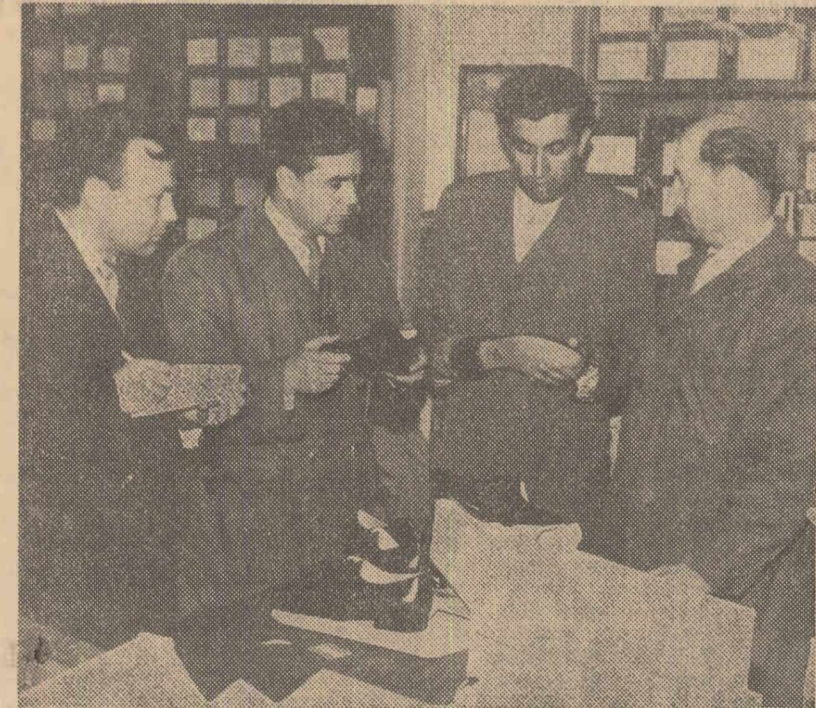
Două mărci de fabrică, „Clujeana” și „Flacăra Roșie” își dispută înfrîntatețea

Celelalte delegații au fost întîmpinate de general de armată I. V. Tiuleniev, vicepreședinte al Comitetului sovietic al veteranilor de război, general-locotenent D. I. Smirnov, Frou al Uniunii Sovietice, și de alți ofițeri superiori.