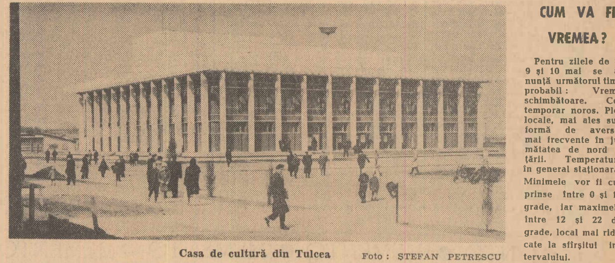
Casa de cultură din Tulcea

CONST. AZOIȚII corespondentul „României libere”