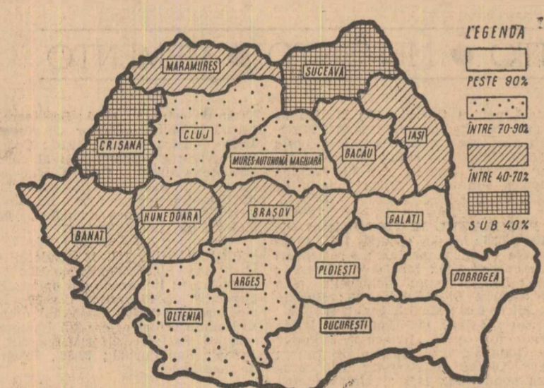
Situația însămînțării porumbului la data de 5 mai

În ultimele zile starea timpului îmbunătățindu-se, semănatul porumbului și al altor culturi s-a desfășurat intens în toate regiunile. Pînă la 5 mai secția de zahăr și floarea-soarelui au fost însămînțate în proporție de 98 la sută față de