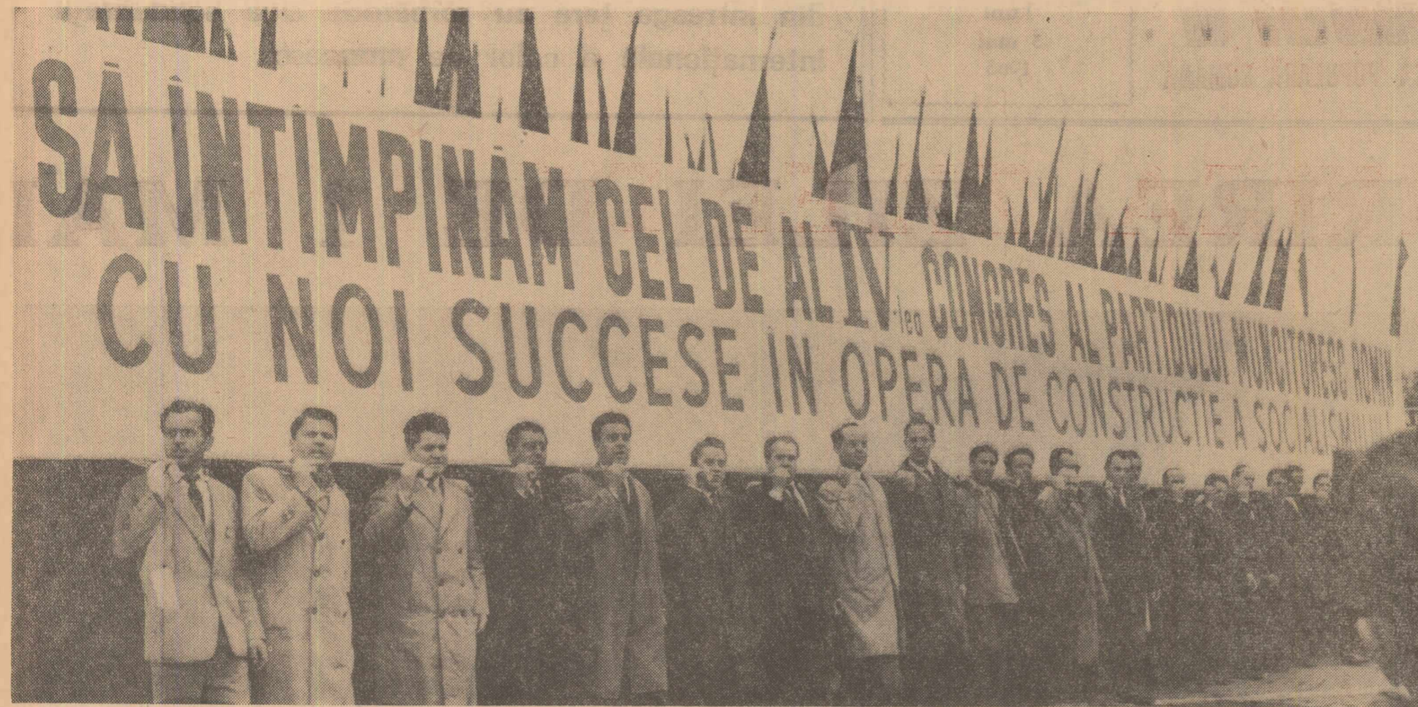
O înflăcărată chemare a oamenilor muncii în întimpinarea celui de-al IV-lea Congres al Partidului Muncitoresc Român