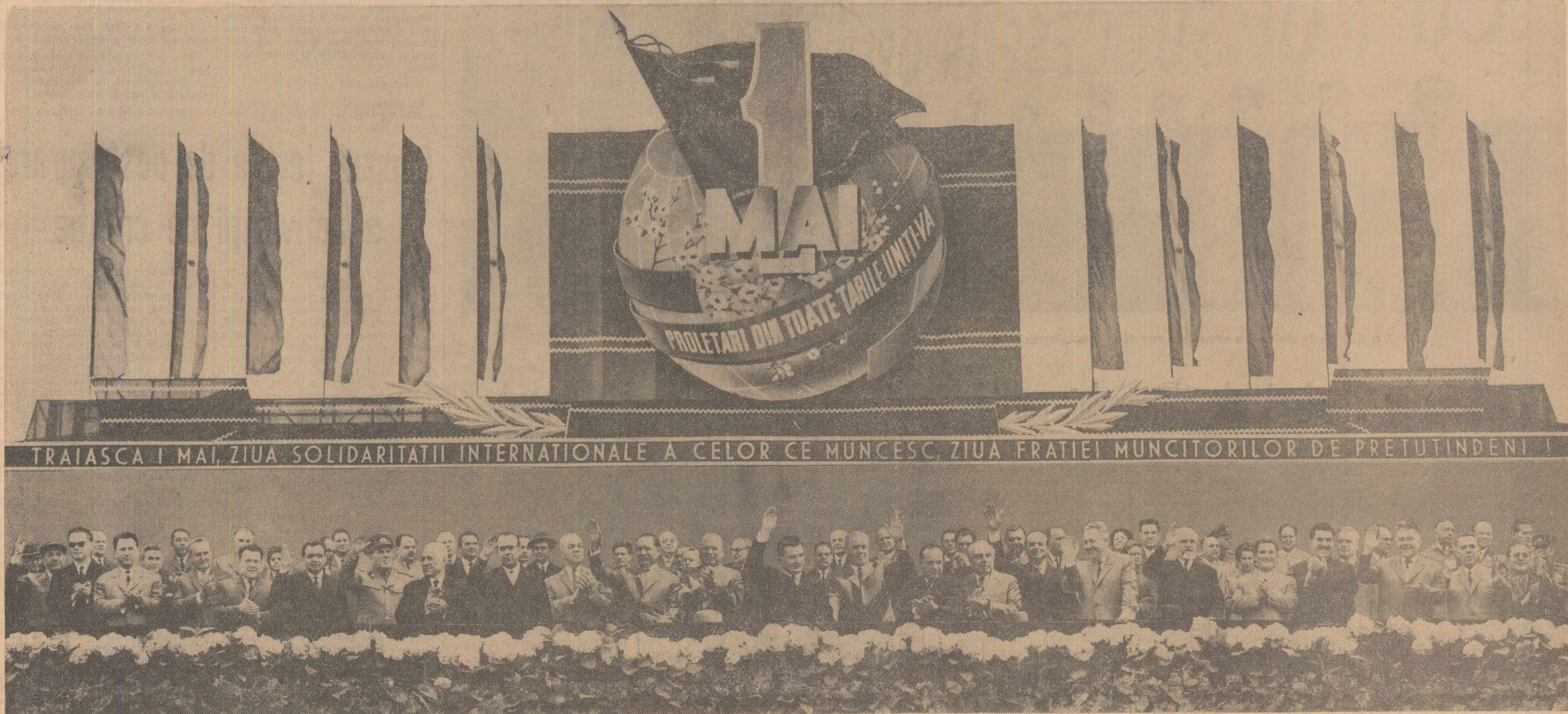
Tribuna centrală în timpul demonstrației oamenilor muncii din capitală