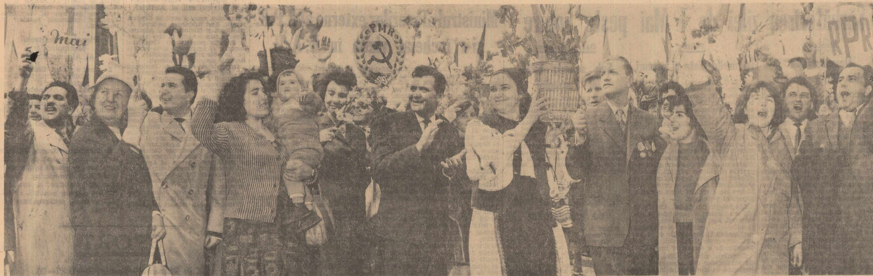
Aspect din timpul marii demonstrații a oamenilor muncii din Capitală