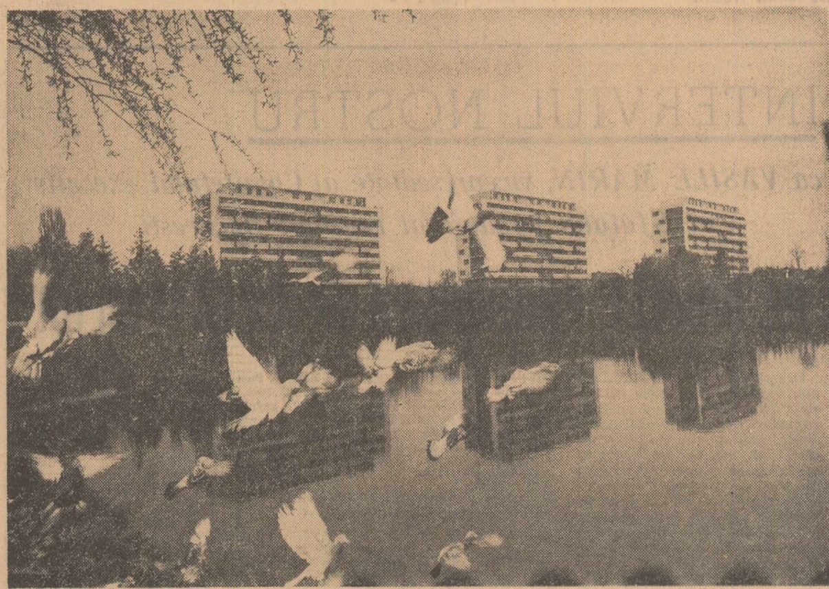
„A venit primăvara” — Parcul Cîrcului de Stat din Capitală