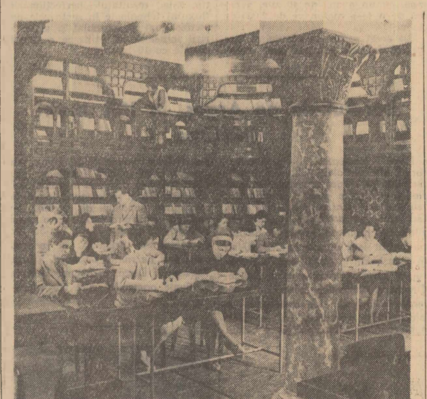
Biblioteca centrală pedagogică din spitalul destinată cadrelor didactice din întreaga țară funcționează sub conducerea și îndrumarea directă a Institutului de științe pedagogice și numără circa 200.000 de volume. Biblioteca centrală pedagogică întreprinde legături de colaborare și schimb cu 84 de instituții și centre de documentare din 49 de țări. În chișeu: Una din sălile de lectură ale Bibliotecii centrale pedagogice.

La prima consfătuire de acest fel care începe astăzi la Bacău, participă delegați din partea celor două ministere, lucrători din întreprinderile industriale și comerciale. Totodată, se vor lua în discuție probleme ale îmbunătățirii prezentării mărfurilor, a condițiilor de depozitare și transport și a reclamei comerciale.