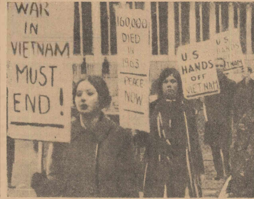
Aspect de la o demonstrație care a avut loc la Londra împotriva acțiunilor Statelor Unite în Vietnam