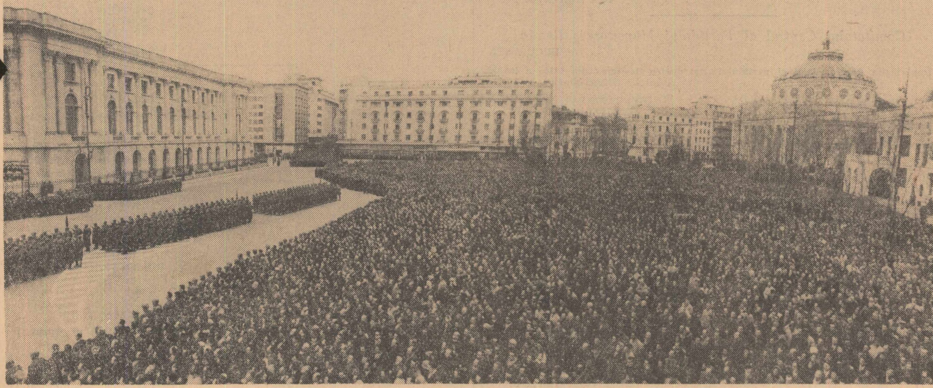
Aspect din Piața Republicii în timpul mitingului de doliu

Adio, scump tovarăș și prieten! Vom păstra în inimile noastre nestinsă amintirea vieții tale luminoase!