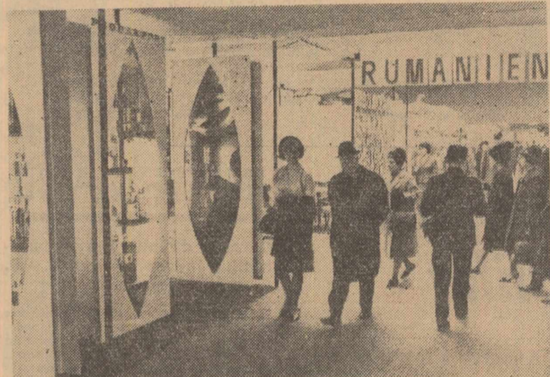
Aspect de la Pavilionul R. P. Romine la Tirgul internațional, din februarie a.c., de la Frankfurt pe Main (R. F. Germană)

sănătății publice a spus: „Încă înainte de a vizita pavilionul, am auzit numeroase comentarii elogioase la adresa acestuia, atît în cercurile guvernamentale, cit și în cele economice. De asemenea, presa a scris mult despre produsele dv., despre Romînia de astăzi, despre succesele economice ale poporului romîn. Ea nu face decît să exprime opinia publică, părerea maselor de oameni, care vizitînd pavilionul, au putut cunoaște Romînia actuală — revelația tirgului”.