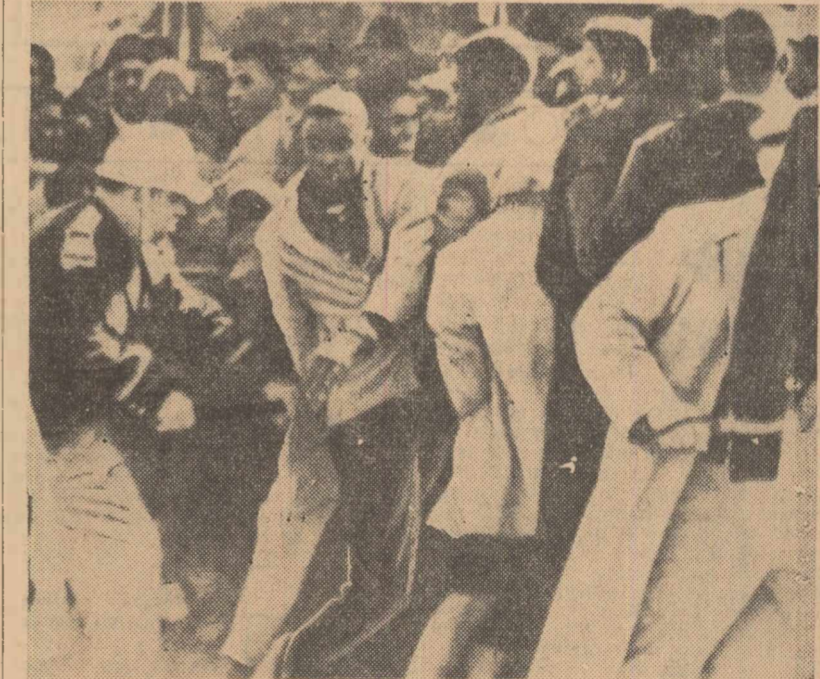
Arestarea unor demonstrații cu prilejul incidentelor rasiale din localitatea Selma — statul Alabama (S.U.A.)

organizat în semn de protest împotriva violențelor la care s-au datat autoritățile din Selma împotriva manifestațiilor populației de culoare. Pe de altă parte, guvernatorul Wallace din statul Alabama, cunoscut pentru pozițiile sale rasiste, a declarat că va împiedica „prin toate mijloacele” marșul negrilor spre Montgomery. Ministerul Justiției a comunicat că F.B.I.-ul a întreprins o anchetă asupra brutalităților de la Selma. S-a anunțat că un agent al F.B.I.-ului, care lua fotografii în timp ce polițiștii călare alungau pe negri, a fost maltratrat de trei albi care i-au distrus aparatul. Cei trei agresori vor fi deferiți justiției.