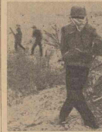
Acțiune pentru „lichidarea inamicului” într-un sat din Vietnamul de sud: soldații Saigonului atacând un tufiș în care s-a ascuns, sperlat, un copil

LONDRA 9 (Agerpres). — Într-o declarație făcută luni la Londra, deputatul, Konni Zilliacus, membru al partidului laburist, a condamnat debarcarea infanteriștilor marini ai S.U.A. în Vietnamul de sud. Hotărârea luată de S.U.A. de a trimite noi trupe în Vietnamul de sud, a declarat el, reprezintă un act „sistematic și deliberat de extindere a războiului în această țară”. El a subliniat că, dacă guvernul S.U.A. „nu va fi oprit de împotriva Angliei — care se alătură celei existente deja, într-o mare măsură, în S.U.A. — am putea fi tirii într-un alt război de tip coreean sau, posibil, într-unul internațional”.