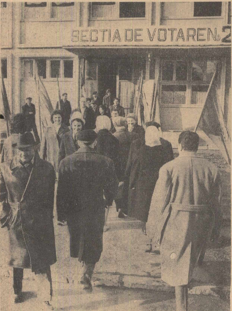
Și la secția de votare nr. 2 din orașul Bala Mare, alegătorii au înținat să voteze încă din primele ore ale dimineții.

lui de frunză pe țară în cadrul întrecerii socialiste pe această ramură. Dacă în 1959 la noi se producea ceva mai mult de un milion de perechi de încălțăminte, în 1964 am produs 2 200 000. După cum s-a scotit la noi în fabrică avem posibilități să realizăm planul de 6 ani al întreprinderii cu 94 zile mai devreme la valoarea producției marfă și cu 60 de zile la valoarea producției marfă. Eu voi face tot ce îmi va sta cu puțință ca aceste posibilități să devină fapte. Și, sînt convins, tovarășii mei vor face la fel.