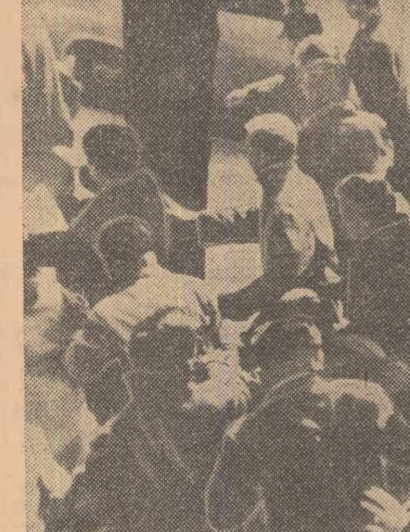
Aspect de la recentele demonstrații studențești de la Madrid

În timpul vizitei, A. Rankovic a fost primit de Gamal Abdel Nasser, președintele R.A.U., căruia i-a înmînat un mesaj personal din partea președintelui R.S.F. Iugoslavia, Iosip Broz Tito.