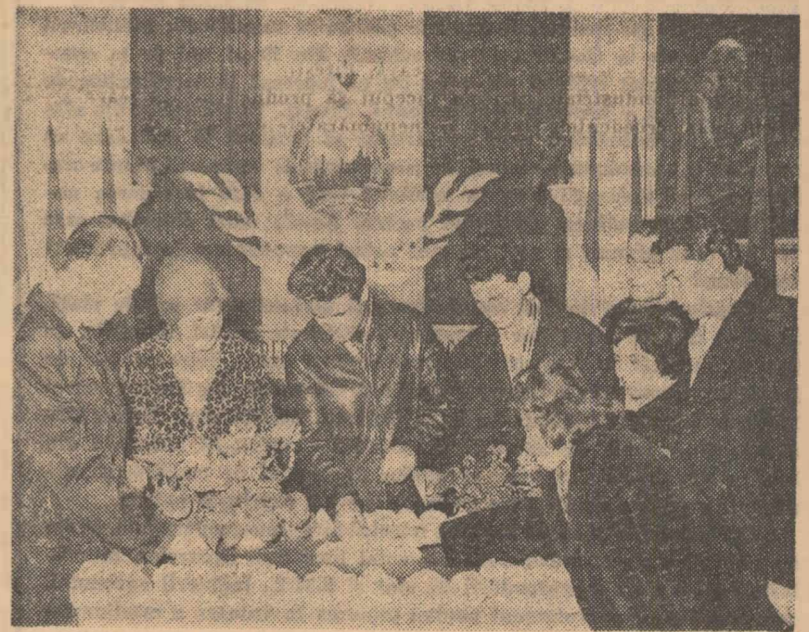
La Casa de cultură din Predeal votează oameni ai muncii sosiți la odihnă în stațiune.