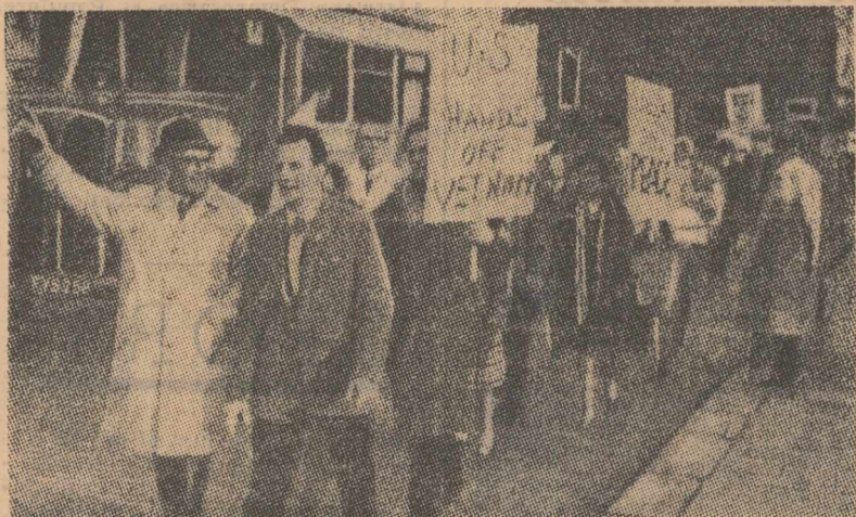
Demonstrație în orașul britanic Glasgow împotriva acțiunilor agresive ale S.U.A. față de R. D. Vietnam

acest fel, autoritățile centrale de la Khartum încearcă să găsească o soluție în mult discutata problemă a „sudului”, înainte de alegerile generale programate pentru luna aprilie. După cum se știe, președintele partidului Sanu și alți membri din gruparea de dreapta au cerut separarea provinciilor sudice de restul țării. Împotriva acestei orientări secesioniste, partidele din nordul țării preconizează rezolvarea dezideratului sudului în cadrul unității Sudanului, acceptînd și eventualitatea acordării unei autonomii regionale pentru provinciile meridionale.