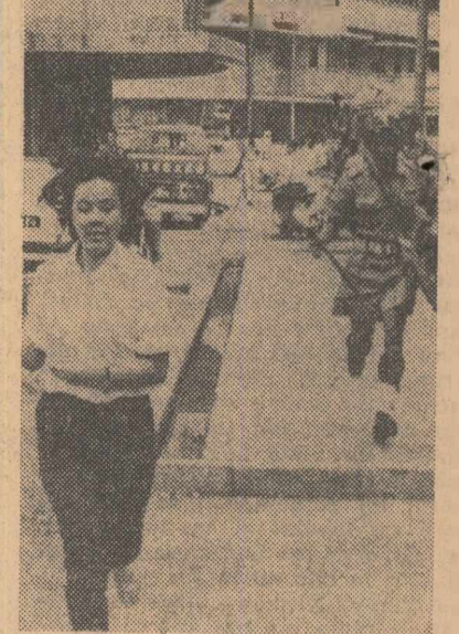
Imagile din timpul uneia dintre demonstrațiile antiguvernamentale de la Kuala Lumpur — capitala Federației Malayezie: o tînără demonstrantă, în timp ce încearcă să scape de sub urmărirea unui soldat din trupele mobilizate de guvern pentru împrăștierea demonstrației