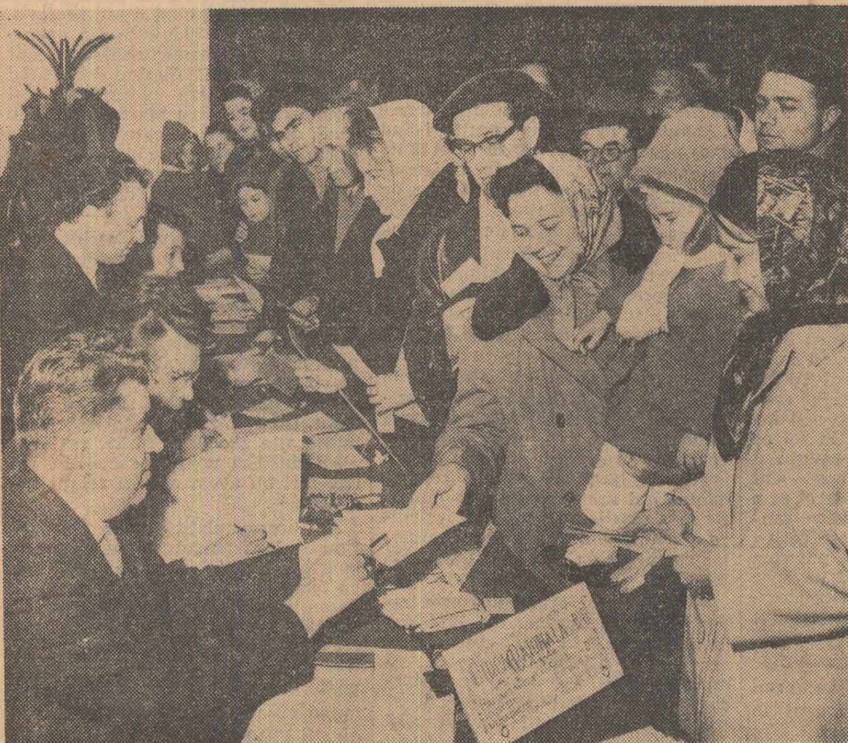
Votază locatarii noulor blocuri de pe șoseaua Giurgiului din București.