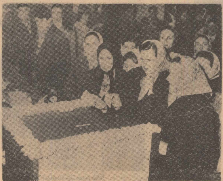
Textiliste din Găvana-Pitești în fața urnei de votare.