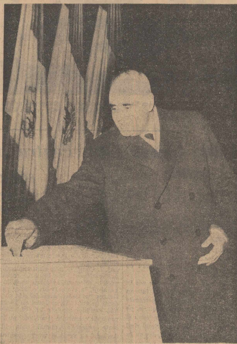
Tovarășul Gheorghe Gheorghiu-Dej votînd la secția nr. 19 „Grivița Roșie” din Capitală