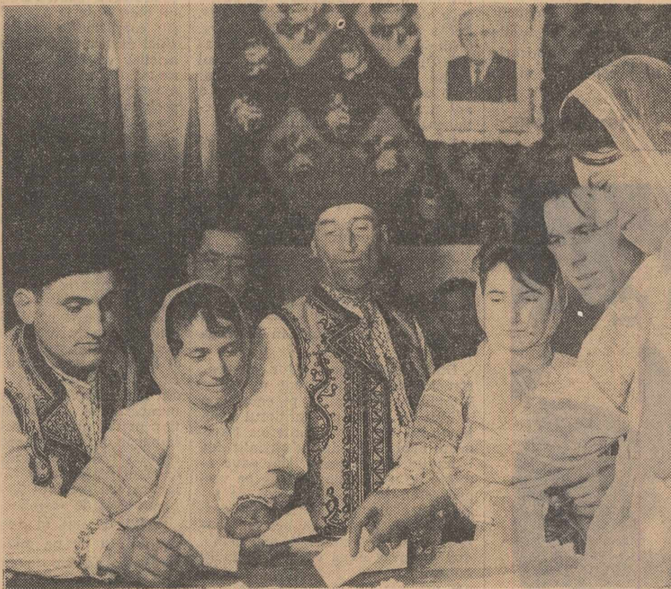
Un grup de țărani cooperatori din comuna Grădiștea, raionul Urziceni la secția de vot.