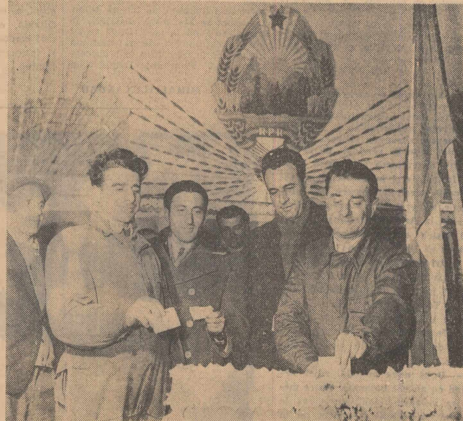
Un grup de sondori de la șcheia Băicoi, în fața urnei.