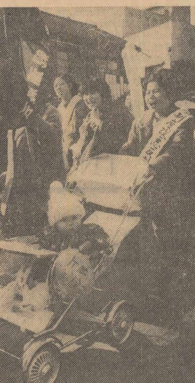
Gospodinele din circumscripția Nakano din Tokio (Japonia) au organizat, recent, o demonstrație împotriva creșterii prețurilor, în special la orez și la serviciile publice. Fotografia înfățișează un aspect din timpul demonstrației.

Președintele Republicii Unite Tanzania, Nyerere, a declarat că țara sa renunță la orice fel de ajutor din partea R.F.G. și că nu este dispusă să accepte vreun imixtiune străină în elaborarea politicii ei externe.