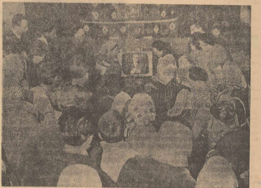
La sămînul culturii din comuna Mogoșani, raionul Găești.

Prin asemenea gânduri, pornite din inimă, și-au rostit oamenii muncii cuvîntul unanim de aprobare a bilanțului de realizări obținute de poporul nostru, sub conducerea partidului, în cei patru ani de la precedentele alegeri. Pentru înfăptuirea minunatelor perspective ce se deschid țării noastre, pentru continuarea înfloririi și prosperității patriei, pentru creșterea prestigiului ei internațional, milioane de cetățeni vor vota la 7 martie conștienți de înalta lor răspundere. Munca lor plină de abnegație, votul lor, vor exprima dragostea și încrederea nefărîmîră a poporului față de puterea populară, față de conducătorul încercat al operei de construire a socialismului — Partidul Muncitoresc Român.