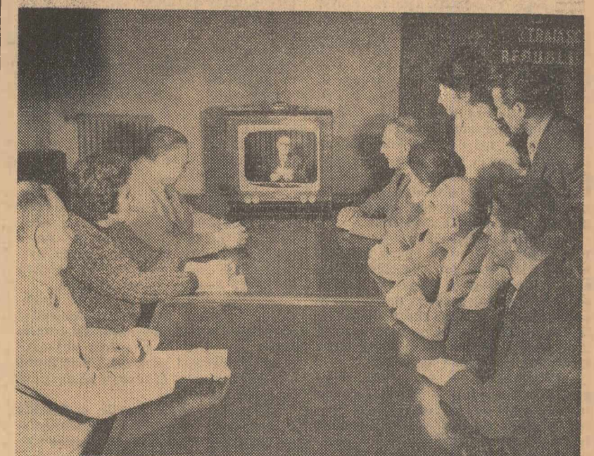
La casa de cultură a raionului Grivița Roșie