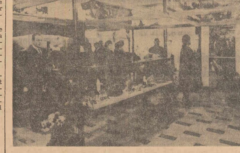
La salonul internațional „Resmal 65” din Stockholm (Suedia) s-a deschis de curînd, o expoziție O.N.T. În fotografie: aspect de la expoziție

ROMA 5 (Agerpres). — În cadrul acțiunilor pentru remanierea guvernului de centru-stînga, primul ministru al Italiei Aldo Moro, i-a oferit oficial vineri dimineață, lui Amintore Fanfani funcția de ministru al afacerilor externe, pe care acesta a acceptat-o. Vineri seara, președintele republicii, Giuseppe Saragat, a semnat decretul prin care Fanfani este numit ministru al afacerilor externe. (După cum se știe, această funcție a fost îndeplinită, de la 28 decembrie 1964, cînd Saragat a fost ales președinte al republicii — pînă în prezent de Aldo Moro). Observatorii politici din Roma apreciază că Fanfani va continua actuala politică externă a Italiei, de sprijinire a alianței atlantice, menținînd totodată, „o poziție independentă în legătură cu unele probleme”. Potrivit agenției France Presse, pentru a compensa pierderea locului de ministru al afacerilor externe, Partidul social-democrat a obținut în guvernul remaniat funcția de ministru al industriei și comerțului.