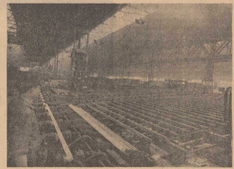
Aspect din secția laminare a uzinelor „Republica”