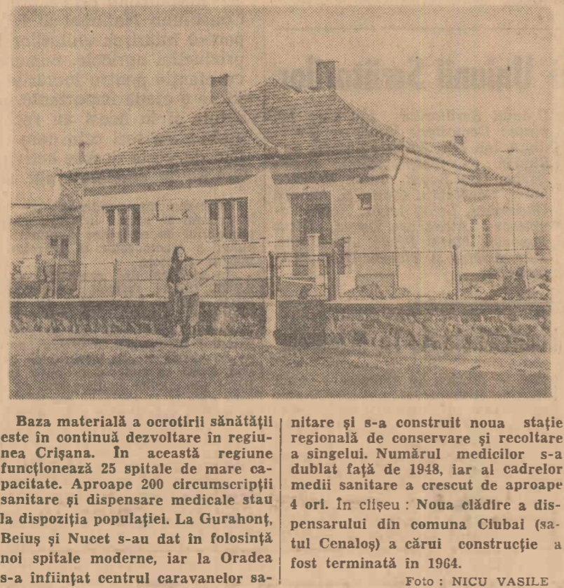
Baza materială a ocrotirii sănătății este în continuă dezvoltare în regiunea Crișana. În această regiune funcționează 25 spitale de mare capacitate. Aproape 200 circumscripții sanitare și dispensare medicale stau la dispoziția populației. La Gurahonț, Beiuș și Nucet s-au dat în folosință noi spitale moderne, iar la Oradea s-a înființat centrul caravanelor sanitară și s-a conservat noua stație regională de construcție și recoltare a singelui. Numărul medicilor s-a dublat față de 1948, iar al cadrelor medii sanitare a crescut de aproape 4 ori. În clădire: Noua clădire a dispensarului din comuna Clubul (sa-tul Cenalș) a cărui construcție a fost terminată în 1964.