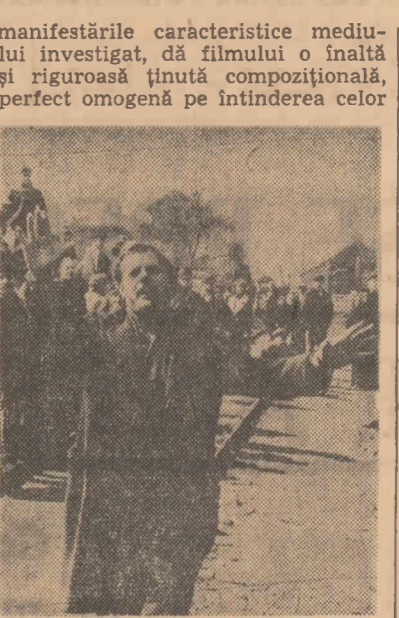
Cadru din film

Un stil concis și simplu, lipsit de orice efecte, bizuindu-se exclusiv pe