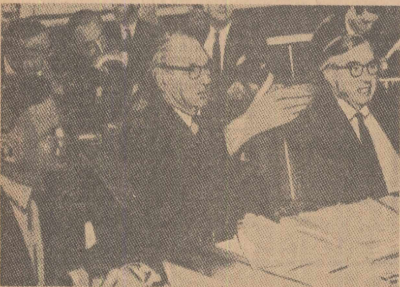
După cum au relatat corespondenții de presă, recenta sesiune de la Geneva a miniștrilor țărilor participante la Asociația europeană a liberului schimb a prilejuit o serie de dezbateri animate datorită pozițiilor divergente ale unora dintre statele membre. În imaginea de mai sus: reprezentanții Angliei argumentând în timpul dezbaterii unei dintr-unele problemele mai controversate ale sesiunii

despre succesele obținute de populațiile de pe continentul african, apreciind că acesta este rezultatul luptei popoarelor pentru libertate și independență, împotriva imperialismului. Președintele Consiliului de Stat al R.D.G. a înmănat președintelui Nasser Ordinul „Marea Stea a prieteniei între popoare”, iar președintele R.A.U. i-a înmănat lui Walter Ulbricht cel mai înalt ordin al R.A.U., „Colanul Nilului”. În numele guvernului R. D. Germane, Walter Ulbricht a înmănat guvernului R.A.U. un act de donație prin care se anunță că R.D.G. va construi și utiliza în mod gratuit pentru R.A.U. un dispensar medical regional.