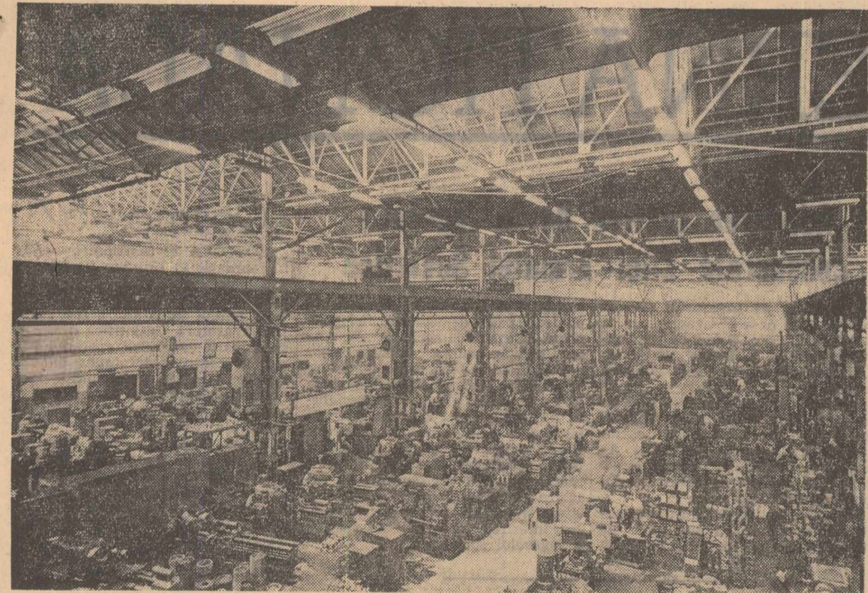
La uzinele „Timpuri Noi” din București, în secția prelucrării-montaj, a fost terminată de curând reamplasarea utilajelor pe linii tehnologice de grup pe reperi. Prin această reorganizare se tinde spre obținerea unei producții mărite, specializarea muncitorilor pe grupuri de reperi și pe această bază realizarea unor produse de calitate superioară. În clișeu: O vedere generală din secția prelucrării-montaj, recent reamenajată.

*) Fragment din lucrarea „Din august până în mai” în curs de apariție la Editura Militară.