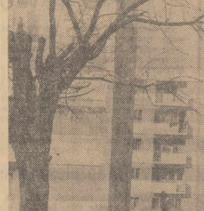
Alci blocurilor noi. În orașul Tîrgoviște au apărut multe asemenea alei