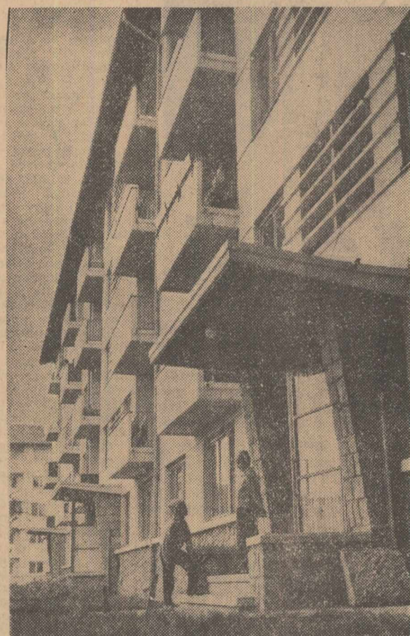
Tineretea Cîmpinei: Dol dintre „beneficiarii” constructorilor stau la sfat

Construcțiile de locuințe — lată un domeniu care afectează pregnant sfera interesului nostru. Cui i-ar putea fi indiferentă casa în care locuiește? Mai ales atunci când această casă se construiește astăzi. la nevoie de azi ale locatarului potrivit nivelului general al civilizației contemporane. S-a spus — și pe bună dreptate — că apartamentul, blocul, cartierul nou construit constituie o oglindă a dezvoltării unui oraș. Oglinzi de felul acesta sînt azi nenumărate, în fiecare regiune a țării, și toate la un loc vorbesc despre grija permanentă a statului socialist pentru îmbunătățirea condițiilor de viață ale oamenilor muncii. Oglinzi de felul acesta ne oferă la tot pasul pe pitoreasca Vale a Prahovei, fie bătrîna Tirgovște, renăscută, fie orașul petrolștilor de la Moreni — întreaga regiune Ploiești.