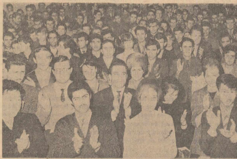
Aspect de la mitingul din aula Facultății de științe juridice din Capitală

Mitinguri ale tineretului și studenților din București și Sinaia