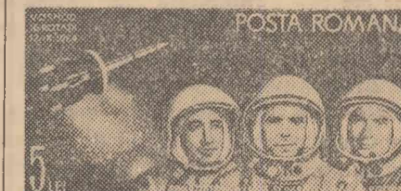
Prin subiectele sale noua emisiune continuă seria marșurilor poștale românești dedicate înfăptuirilor omului în cucerirea spațiului cosmic.

hod”, la bordul căreia a efectuat un zbor cosmic primul echipaj complex, format din trei cosmonauți.