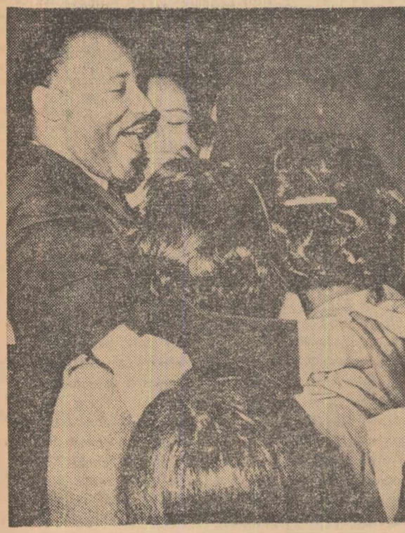
Dr. Martin Luther King, prim-ministru al căldură după eliberarea sa din închisoarea de lângă Selma, unde a fost detinut pentru faptul că a luat parte la demonstrațiile care cereau dreptul la vot pentru negri.