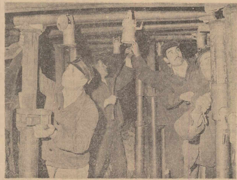
Brigadierul Ion Nasta, candidat al F.D.P. pentru Marea Adunare Națională (primul din stînga) în mîină cu o parte din ortaciul său