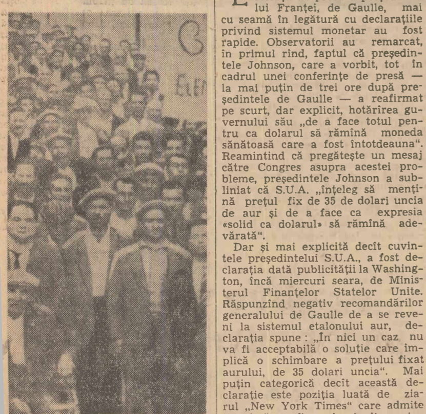
Muncitorii agricoli din provinciile Catanzarita, Catania și Palermo din Sicilia (Italia) au organizat, recent, o serie de demonstrații în sprijinul revendicărilor lor economice. Fotografia înfățișează un aspect de la o demonstrație, în localitatea Nisemei

Primul ministru norvegian a subliniat că vizita sa în Anglia a fost fructuoasă, ea prilejuind un larg schimb de vederi cu primul ministru Harold Wilson și alte oficialități britanice. Singura problemă care tulbură relațiile anglo-norvegice, a declarat el, este „controversata suprataxă de 15 la sută pe care guvernul britanic a fixat-o asupra impor-