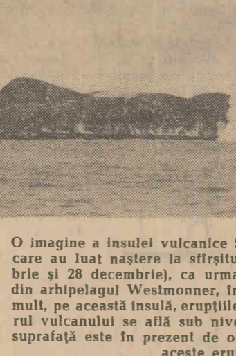
O imagine a insulei vulcanice Surtsey, prima dintre cele două insule care au luat naștere la sfîrșitul anului 1963 (respectiv la 14 noiembrie și 28 decembrie), ca urmare a erupției unui vulcan submarin din arhipelagul Vestmanner, în apropierea coastelor Islandei. Nu de mult, pe această insulă, erupțiile vulcanice au reînceput. Deși craterul vulcanului se află sub nivelul mării, se crede că insula, a cărei suprafață este în prezent de o milă, se va mări considerabil dacă aceste erupții vor continua