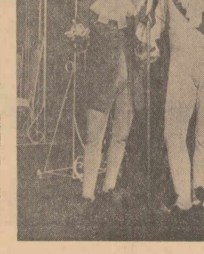
La Teatrul regional București a avut loc ieri seară o nouă premieră. Este vorba de spectacolul cu „Școala nevestelor” de Molière, în regia lui Ion Simionescu. În clișeu: Scenă din „Școala nevestelor”.

Can-Can: Patria (11.88.25) orele 9.30 — 12.30 — 15.30 — 18.30 — 21.15; Cîntînd în ploaie: Republica (11.03.72) orele 9.45 — 12.15 — 14.30 — 17 — 19 — 21.15; București (15.61.54) orele 9 — 11.15 — 13.45 — 16.15 — 18.45 —