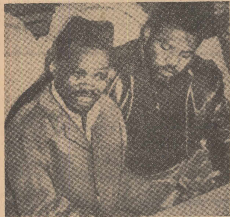
Gaston Soumialot (stînga) și Nicholas Olenga, doi dintre conducătorii forțelor patriotice din Congo, în timpul unei recente conferințe de presă ce a avut loc la Cairo

lupta de eliberare din Africa, deoarece Chombe este apărătorul intereselor unor țări străine. Soumialot a subliniat că Chombe își poate plăti mercenarii, datorită ajutorului pe care îl primește din partea unor țări, care l-au ajutat și până acum. Agenția France Presse, citind unele surse sigure, transmite că Gaston Soumialot, ministrul apărării în guvernul revoluționar congolez, se află acum la Nairobi. El urmează să se întâlnească cu președintele Jomo Kenyatta și cu alți conducători ai Kenyei, pentru a expune situația din Congo. După aceasta, Soumialot intenționează să plece la Dar Es Salam.