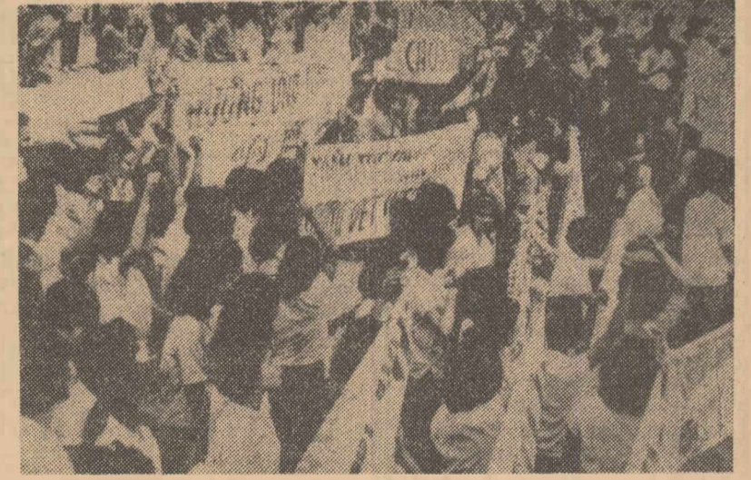
Aspect de la o recentă demonstrație antiguvernamentală a muncitorilor textiliști din Saigon — capitala Vietnamului de sud

Maxwell Taylor. Ei au fost împreștiați numai după ce poliția a făcut uz de gaze lacrimogene și bastoane de cauciuc. După ce au fost dispersați, demonstrații au încercat să se îndrepte spre reședința șefului statului și a primului ministru, dar au fost opriri de către armată. Palatul prezidențial și alte instituții publice din Saigon sînt inconjurate de cordoane de polițiști și parașutiști. Detașamentele, care continuă să patruleze pe străzi, au oprit mai multe arestări.