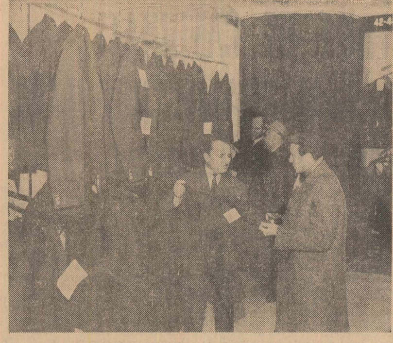
Noul magazin de confecții bărbătești „Adam” din Capitală se bucură de interesul a numeroși cumpărători. Aici s-au pus în vânzare — pe lângă noi articole vestimentare — diverse accesorii (cămăși, pljamaie, articole de tricotație și de marochinării etc.). În clipă: Aspect de la raionul de confecții

Cel 33 de membri ai brigăzii amintite s-au angajat ca în lunile viitoare să atingă un randament mediu de lucru de 15 tone cărbune extras pe post.