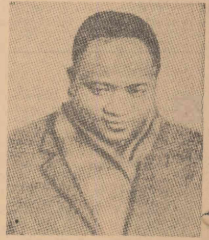
Fotografia reprezintă pe primul ministru al regatului Burundi

BUJUMBURA 20 (Agerpres). — Potrivit agenției France Presse, miercuri a fost arestat la Bujumbura asasinul lui Pierre Ngendandumwe primul ministru al regatului Burundi. Acesta este un cetățean de origine ruandeză și lucrea în calitate de contabil la Ambasada S.U.A. Asupra asasinului s-a găsit suma de 3.000.000 franci burundezi care, potrivit agenției menționate, i-ar fi fost dați de un individ de „origină străină, care era însoțit pentru asasinarea primului ministru. Asasinul a fost transportat la locul crimei de un cetățean care, de asemenea, „nu era de origine africană”. Anchetă în legătură cu asasinatul din 15 ianuarie continuă.