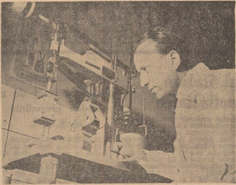
In cadrul Institutului de cercetări în construcții se fac numeroase determinări privind rezistența materialelor. În clipșu: Aspect reprezentiv al asemenea determinare.

Can-Can: Patria (11.65.25), orele 9.30 - 12.30 - 15.30 - 18.30 - 21.15; Cîntînd în ploaie: Republica (11.03.72), orele 9.45 - 12.15 - 14.30 - 17 - 19 - 21.15; București (15.61.54), orele 9 - 11.15 - 13.45 - 15.15 - 18.45 - 21.15; Tomis (21.49.48), orele 8 - 10.15 - 12.45 - 15.15 - 17.45 - 20.15; Medolia (12.06.88), orele 9 - 11.30 - 14 - 16.30 - 19 - 21.30; Cu miinle pe