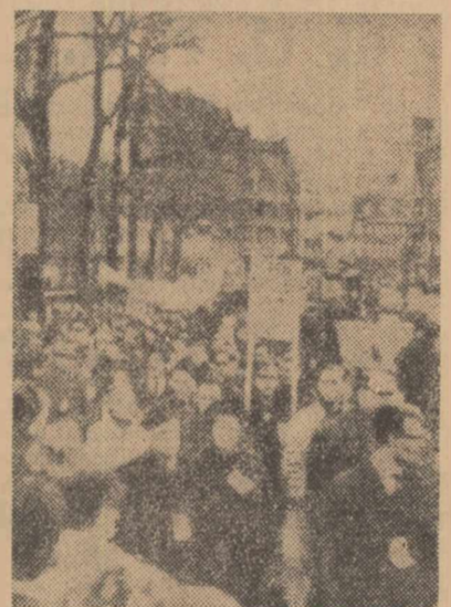
Aspecte din Amsterdam pentru dezarmare și pace

Vorbind de poziția guvernului francez față de participarea R. F. Germane la „planificarea nucleară a N.A.T.O.”, Lebel a subliniat că „poziția guvernului francez este bine cunoscută”, dar Franța consideră că participarea R. F. Germane la planificarea nucleară „este perfect legitimă”.