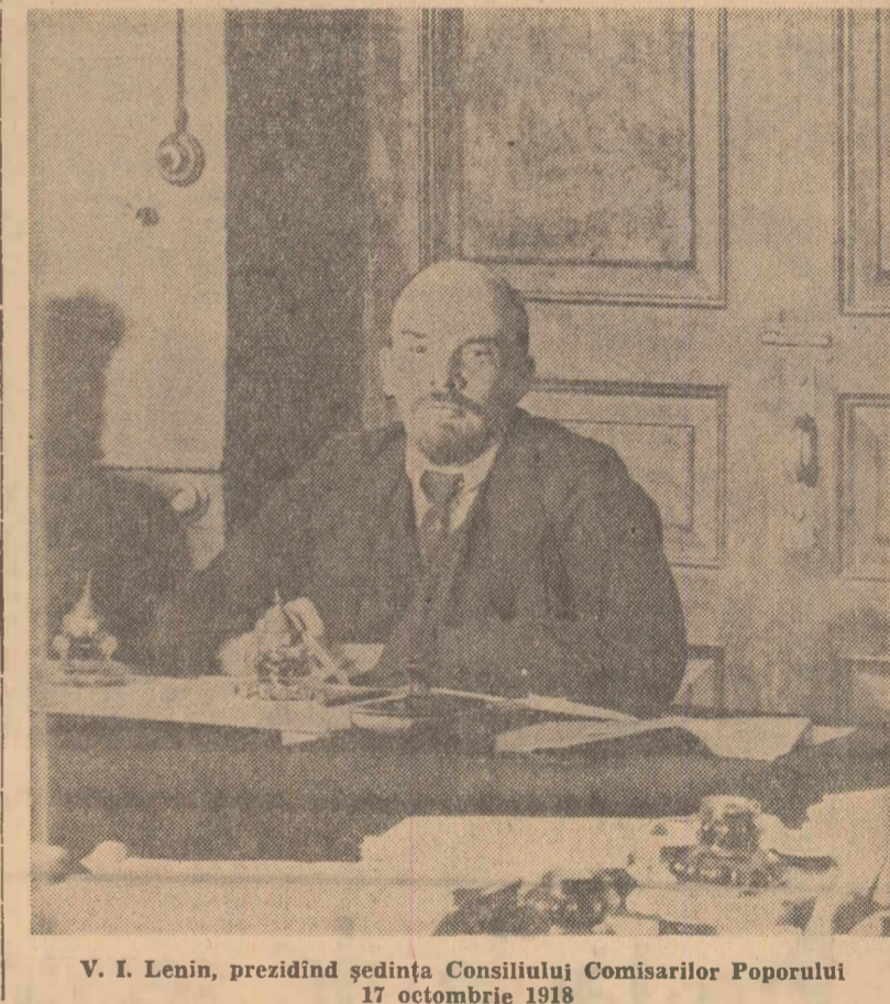
V. I. Lenin, președinte ședința Consiliului Comisarilor Poporului 17 octombrie 1918